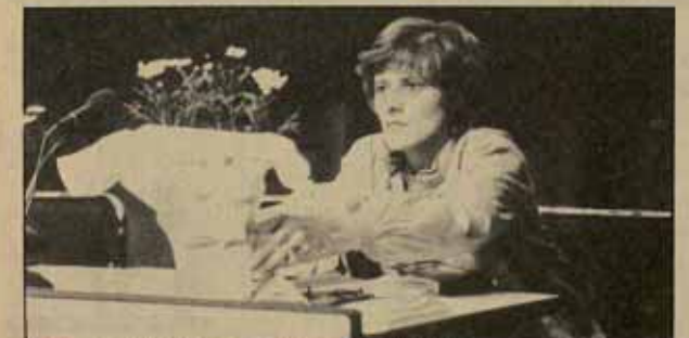
Petra Kelly, diputada verde en el parlamento alemán, tuvo una destacada participación en la II Conferencia Europea por el Desarme Nuclear.

Todas estas debates son importantes, pues en claro modo van a determinar el futuro del movimiento pacifista. Si en Ginebra se llega a algún acuerdo intermedio, si no se llega a ningún acuerdo, y en todo caso a despliegue de los americanos, hará