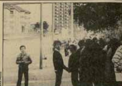
La delegación de Euskadi en la Conferencia, junto con la Comisión anti OTAN de Madrid, fueron las más activas del Estado español.

COMUNICADO DE LA DELEGACION DE LOS COMITES ANTINUCLEARES DE EUSKADI EN LA CONFERENCIA POR LA PAZ Y EL DESARME NUCLEAR DE BERLIN