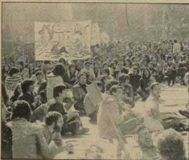
El próximo mes de octubre comenzarán las pruebas en el reactor nuclear de Cofrentes. El tema despertó la protesta de muchas valencianas.

En estos momentos, a pocos meses de su puesta en marcha, el grito contra Cofrentes ha de ser más fuerte que nunca. Hay que exigir que la voluntad del pueblo no sea sacrificada al interés económico del monopolio eléctrico. Si los trabajadores valencianos no somos capaces de levantar en los próximos meses un fuerte movimiento contra la central, ninguno lo parará. Daremos otro paso (y ya son muchos) ante la degradación irreversible de nuestro país. No lo podemos permitir; hemos de parar entre todos, la nucleara. □