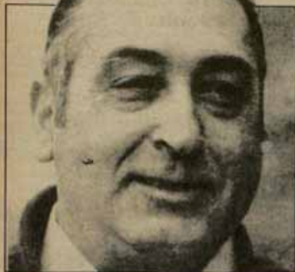
XXXIII CONGRESO DE UGT