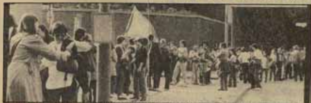
Tras el acto de clausura de la Conferencia se realizó una cadena por el desarme nuclear que unió las embajadas de Polonia y Portugal. (Foto: ISKRA PRESS).