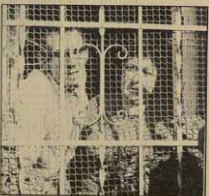
(Vecinos) Mañana día 16 de los 4 de la tarde quieren desahuciar a una familia obrera. Impedido.

Así pues, vemos como los trabajadores y el pueblo seguimos siendo apaleados, perseguidos y detenidos por las fuerzas policiales, por el mero hecho de exigir puestos de trabajo, amnistía o libertades democráticas y nacionales. Actuaciones de este tipo, junto con otras que encuentran la impunidad por parte del gobierno y sus encima son reforzadas con disposiciones como la reciente sobre venta y alquiler de pisos, demuestran que el cambio socialista no va más allá de lo que en su día hacían en el terreno del orden público: los Martín Vela, Rosón y compañía.