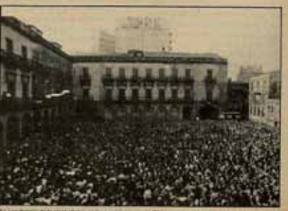
En un momento de la concentración de desmantelamiento de Sidem metalúrgica en la base del Metal en Gijón del 25 de mayo.

A la hora de crear esta información, se están preparando las acciones de respuesta. El pleno de Comité de Duro Felguera está reunido y se han convocado un pleno de Comité del sector Naval y otro a nivel de Gijón. Los conflictos obreros acumulados pueden encontrar un potente detonante. □