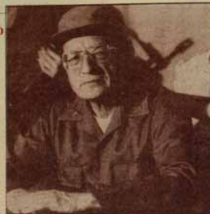
Salvador Cayetano Carpio, Comandante "Marcial"

A fines del 53 organiza con otros la fuga de varios presos políticos del Cuartel General de la Policía, pero fue capturado poco después. Se pone en libertad de hombres, que desarrollan la solidaridad de la AGEUS (Asociación General de Estudiantes Universitarios Salvadoreños). Así comenzó, a los 21 días, hacia presentado ante los Hombres. Fue puesto en libertad 8 meses después, con su salud debilitada. El PC decidió enviarse a la URSS donde estuvo dos años y medio. Volvió