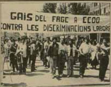
"Necesitamos un reforzamiento de nuestras organizaciones"