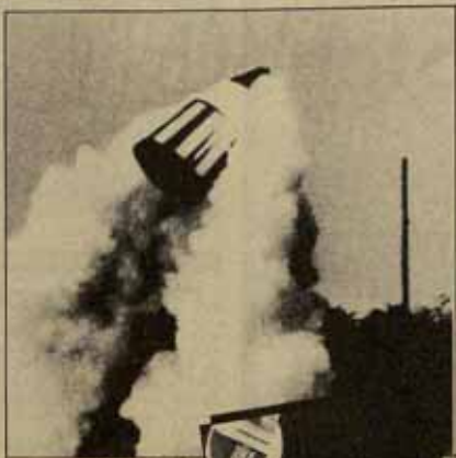
Los proyectos del presidente Reagan son una amenaza para la humanidad. El imperialismo yanqui se prepara para atacar y está dispuesto a llegar a la guerra.

• Esta lógica infernal implica la abolición de los tratados existentes, en particular el acuerdo de limitación de los sistemas antibalísticos, firmado en 1972 entre Moscú y Washington.