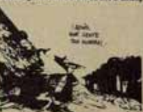
Donostia. Lo que hay que cambiar

(el otro medio) nas lo pretemos en cuatro días)