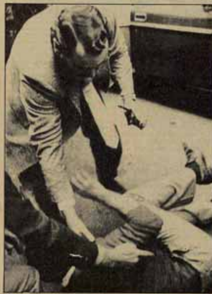
Almiron en acción. Esta vez contra manifestantes en Victoria, este mismo año.

se podría simbolizar en que bajo una de sus alas cabían los franquistas, golpistas, fuerzanovistas y en la otra los "moderados", su nueva adquisición. Pero lo que no se podía olvidar es que esas alas no eran las de un ave cualquiera, sino las alas de una verdadera ave de rapina. El destape del asesino Almiron que guardaba sus espaldas mientras hablaba con amas de casa en los mercados, acariciaba cabezas de niños o firmaba autógrafos en la calle, es — por ahora — sólo el broche de oro que le faltaba para completar su atuendo.