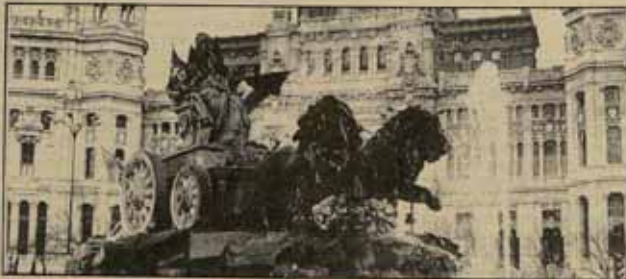
una candidatura unitaria.

Considerábamos, y seguimos considerando, que para ello hubiera sido un paso importante la confluencia electoral de todos estos sectores, pues habría sido la ocasión de discurrir diferencias que muchas veces son ficticias, eliminar resquemores injustificados, definir claramente qué es lo que nos une y lo que nos separa y, en definitiva, alcanzar una plataforma de acción común sobre la base del respeto a las distintas posiciones y sensibilidades de cada cual. Además, habríamos terminado así con la anómala situación de que muchos miles de personas se encuentran, en cada elección, con que deben abstenerse o votar de mala gana a partidos con los que están en desacuerdo en las luchas cotidianas y en sus planteamientos generales. He ahí el segundo objetivo que todos aquellos que le simpatizan de izquierda revolucionaria, ecologistas, feministas, alternativos, los sectores radicales de los movimientos sindical y vecinal, etc., pudieran reconocerse en