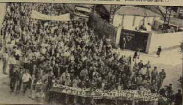
Calles de la manifestación de 10.000 personas que a las 6 de la tarde del día 15 salió de Talleres de Moreda hasta llegar al centro de Gijón.

Los gritos más sonados fueron los de "HUELGA, HUELGA, HUELGA GENERAL", "¡ASTURIAS SE SALVA LUCHANDO!", "¡FELIPE, GUERRA, MOREDA NO SE CIERRA!" y "¡MOREDA EXPROPIACIÓN!". Esta última es la alternativa que reivindican los trabajadores de Talleres de Moreda que vienen protagonizando duras y continuadas acciones. El martes día 12 formaron una gran barricada incendiando un camión hasta inutilizarlo con buen acopio.