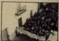
DOS HERMANAS (SEVILLA)