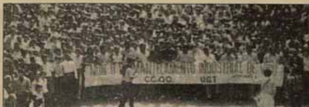
Tres kilómetros de manifestación. Tras la cabeza van los representantes de CC.OO., UGT e INTG. 200.000 obreros y estudiantes, organizados en comités por sectores, ocuparon las calles de Vigo. Era la Huelga General del 15 de abril.