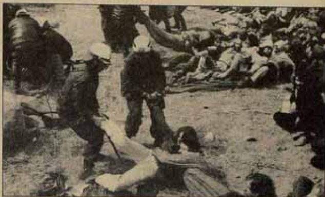
El movimiento pacifista ha adoptado una postura clara sobre la "propuesta intermedia" en cualquier forma la aceptará los euro-misiles.

A SI, descendiendo la escalera de peldafío en peldafío, se hunde cada vez más en el fango. Hay esa "realismo" y otro realismo muy distinto: el de la decisión de los pueblos que luchan contra la opresión y la explotación. Y ese realismo es el que debemos practicar los revolucionarios del Estado español: impulsar la solidaridad activa con el pueblo saharaui, el pueblo palestino, los pueblos centroamericanos, el pueblo ecuatoriano; impulsar la creación y las actividades de comités de apoyo unitarios; impulsar la acción para exigir la salida inmediata de la OTAN y el desmantelamiento de las bases yanquis.