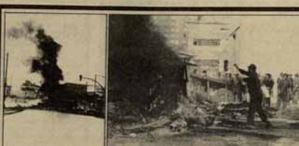
Obreros de Talleres de Moreda con mano, casco y muchos años de trabajo en una empresa que ahora les quieren cerrar, alimentan el fuego de una inmensa barricada con la que cortaron el tráfico incendiando un camión. Tras el humo, la furgoneta de la policía llega rápidamente. Lo que no llegan son los soldados exigidos por los trabajadores de Moreda: la expropiación de su empresa.

Hacia adelante se está discutiendo de la convocatoria de nuevas acciones, manifestaciones y huelgas de los trabajadores de todo el sistema financiero (banca oficial y banca privada) hacia finales de mes, propuesta que ya CC00 se ha planteado. En el Banco de España (banca oficial) donde la dirección plantea un aumento salarial del 8,25% y un aumento de jornada del 10%, no se ha aceptado. En 106 horas anuales más, los trabajadores se proponen llevar a cabo una huelga por los días 29, 30 y 31.