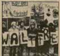
«Movimiento por la paz y la paz mundial». La Comisión anti-OTAN de Múnich organiza, autocore, para todos y

Temas de algunas conferencias: desarme nuclear; mediación del desarme de guerrillas y terrorismo del nuevo sistema de armamentos; la instalación de nuevos misiles en Europa; «Programas alternativos para la paz en Europa»; «Europe libre de armas nucleares»; «Nuevo armamento y estrategia de la OTAN. Nuevas de investigación»; «Significado del desarme en Europa occidental y oriental».