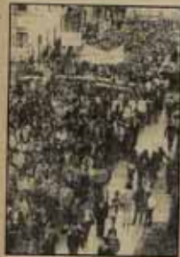
SE PREPARAN NUEVAS HUELGAS PARA FINAL DE MES