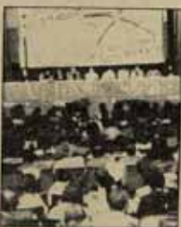
va bastante por delante de su definición política, a veces condicionando esta última.

Una virtud de EMK, y la decimos con respeto e incluso con un punto de admiración, ha sido la de su consentimiento en la apertura de vías propias de afirmación en sus planteamientos políticos. Es cierto que en consecuencia con nosotros resultamos muchas veces frustrados por nuestra educación ideológica. Pero aún y todo, podemos advertir que la práctica de EMK,