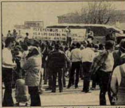
4 Los discursos finales no fueron seguidos con mucha atención. Os recordamos que el compañero de Zaragoza anunció otra manifestación para el 29 de mayo.