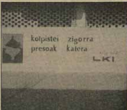
LKI convoca el Aberri Eguna 83 por el euzkera contra la represión y por la autodeterminación de Euzkadi; e irrin contra el proyecto político del PNV y por todas las reivindicaciones que están presentes en las luchas del pueblo vasco.

Aunque hubo momentos de tensión entre las fuerzas participantes en estos pactos, esa política tuvo un gran éxito. La clase obrera perdió el protagonismo social que tenía, perdió confianza en sus propias fuerzas, fue profesionalmente desmovilizada y dividida. El Estado suprimió la exigencia de soberanía nacional, afirmó el compromiso con una Constitución que había sido previamente rechazada en Euzkadi y dividió institucionalmente a Navarra del resto de nuestro pueblo. El Gobierno central afirmó entonces su propia respuesta contra quienes habían resistido: la simbólica aplicación de la tortura, la muerte de milicianos revolucionarios,