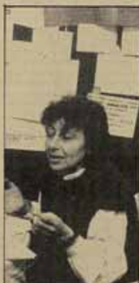
La mayoría de la población lo que nos tiene es acceso a la información.

—¿Hasta qué punto tu condición jurídica condiciona tu capacidad para decidir libremente tu participación en las