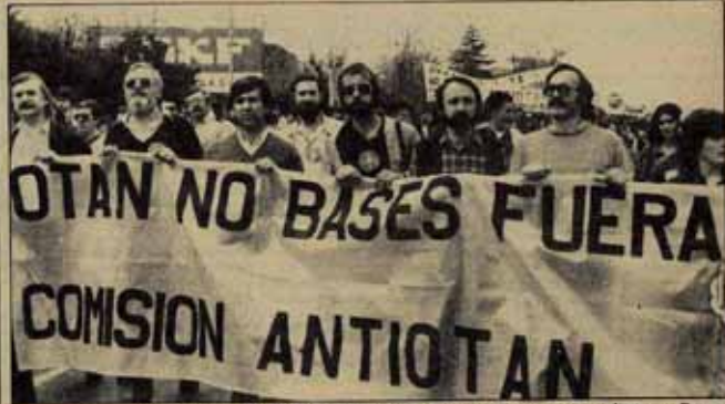
2 La cabeza de la Marcha parece posar para nuestra cámara. Como puede apreciarse no estaba en ella ni el "candidato a la alcaldía por el PCE" ni "el dirigente de CC.OO. Fidel Castro (!!!)", tal como informó el lunes el diario de derechas "ABC".