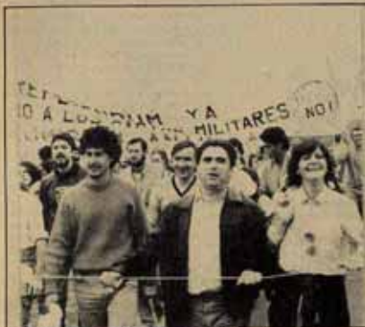
1 Primer plano del servicio de orden de la Marcha. Sobrevuela un avión. (J.L. García. ISKRA PRESS).

Combate número 300. Por cierto que hemos recibido muchas críticas por no haber insertado pies de fotos la semana pasada. Reconocemos el error y tratamos de demostrar que hemos aprendido algo. A ver si es verdad.