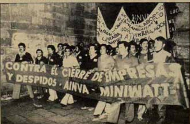
Los trabajadores de Miniwatt tienen una larga tradición combativa