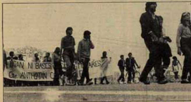
3 La larga Marcha contra la base de Torrejón gana cada año en participación y combatividad.