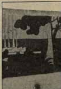
En el interior de Euzkadi, nos enfrentamos también frente a proyectos como la Ley de Territorios Históricos, la organización de las zonas electorales, etc. del PNV, con los que intentan reducir el peso electoral de la clase obrera. Nos enfrentamos con la política que el Gobierno Vasco está manteniendo sobre el euzkera en el que trata de destruir toda la organización popular que durante años ha acumulado.