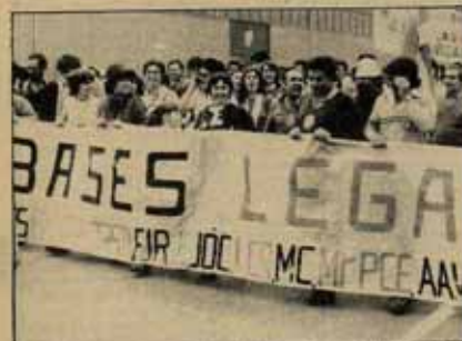
5 Ahora lo que hace falta es reforzar la unidad y los comités anti-OTAN en todos los barrios y pueblos... (J.L. García. ISKRA PRESS).