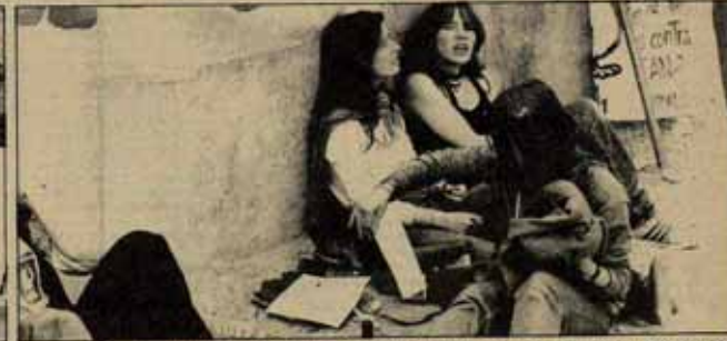
6 ...Que la juventud se levante y que siga la marcha....