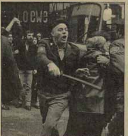
El PSOE, en primer lugar, está comprometido con el centralismo y la represión de nuestro pueblo.

El PSOE ha hecho suyo, con todas las consecuencias, la "tortura de Estado"; y se ha convertido en el partido responsable de una intoxicación mayor aún, del "nacionalismo de Estado", en el interior de la clase obrera. Ha restituido su decisión de mantener la LOAPA y con más fuerza aún, de mantener la división de Euzkadi en dos comunidades autónomas. Ha restituido su negativa al derecho democrático de autodeterminación y su compromiso en la defensa de la "unidad de la patria socialista".