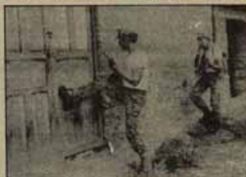
Registro de población de la zona de Ayacucho.

La matanza de Ayacucho ha sido un paso más en la escalada de represión sangrienta que sufre el pueblo peruano. Es la plasmación trágica de la conculcación de los derechos humanos que se sufre en ese país andino junto a unos índices de paro, miseria y explotación crecientes. El gobierno de Bértola y su régimen podrido son los responsables. □