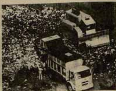
Miles de toneladas de basuras se agotan en Montaña del Aire, amenazando la tierra y el agua.