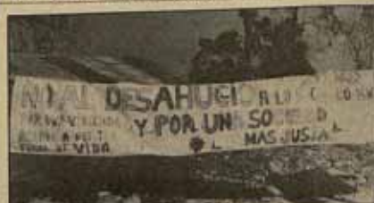
"...a esto se le une la discriminación racial que sufrimos los gitanos".

Apartado de Correos 50.370 (Cibeles) Madrid