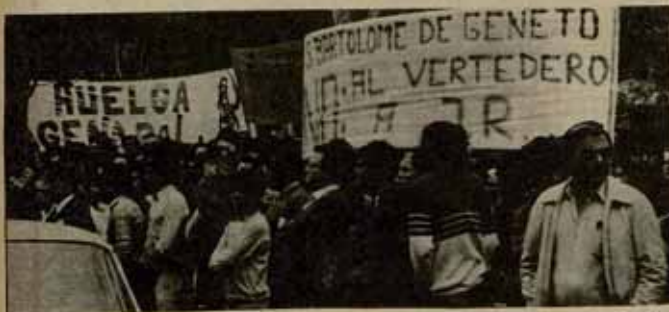
El cierre de Montaña del Aire y la puesta en marcha de una planta de reciclaje en el sur de Tenerife, son dos exigencias de la población que aún no se han cumplido.