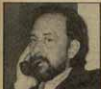
EL DIPUTADO SOCIALISTA APOYARÍA LA ILEGALIZACIÓN DE HERRI BATASUNA