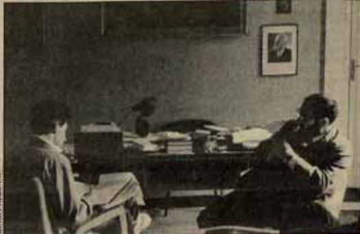
"He pretendido superar a Manzoni, cuya novela 'Los novios' es la más grande novela italiana de todos los tiempos".