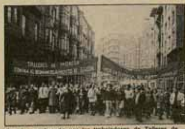
Cortejo encabezado por los trabajadores de Talleres de Moreda en la Huelga General de Gijón del día 25.

Recientemente el Comité de Empresa, con mayoría de la Corriente de Izquierdas se negó a firmar un expediente de regulación de empleo que afectaría al 90% de la plantilla. Asimismo desoyó las órdenes del Delegado del Gobierno en Asturias en el sentido de evitar las acciones que cada día desarrollan en la calle. Los representantes sindicales reiteraron su voluntad de seguir luchando con todos los medios a su alcance para impedir el cierre de la factoría y exigir a la Administración que haga frente a sus responsabilidades. □