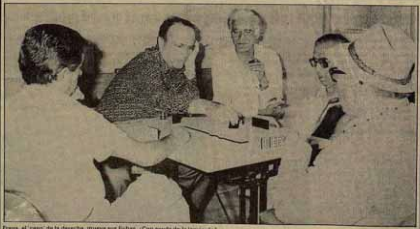
Fraga, el 'cabe' de la derecha, mueve sus fichas. ¿Con ayuda de la izquierda?

Sr. Fraga, Sr. González, ¡que no. Que el país no cabe en sus cabezas, por difícil que esto parezca en el caso de Fraga.