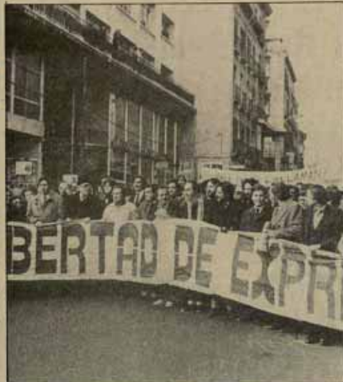
ENRA PRESEIZ LA URBANA

Todavía somos pocos en las asambleas —al menos en Madrid— pero podemos ser más si sabemos dar continuidad a la lucha iniciada y demostrar a la gente que es eficaz una posición activa en la batalla por la libertad de expresión. Y, desde luego, la capacidad de convocatoria a las manifestaciones de Barcelona y Madrid no ha estado nada mal. Hay que seguir. El objetivo merece la pena. □