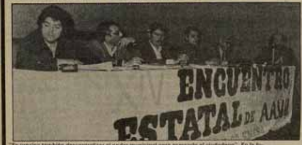
"Es preciso también descentralizar el poder municipal para acercarlo al ciudadano". En la foto, la mesa presidencial de los XIV Encuentros Estatales de las AA.VV.

En definitiva, la Coordinadora está exigiendo al Gobierno que cumpla lo acordado, está exigiendo que no se juegue con las viviendas y las esperanzas de 30.000 familias de trabajadores que llevan años de lucha para conseguir una vivienda digna. Está exigiendo al PSOE que así tenga un acto tanto la misma agilidad y los mismos recursos que se emplearon para subir los precios, para gastar cientos de miles de millones de pesetas en armas o para coher a las presiones del gran capital (40.000 millones de pesetas al Banco Hispano Americano). □