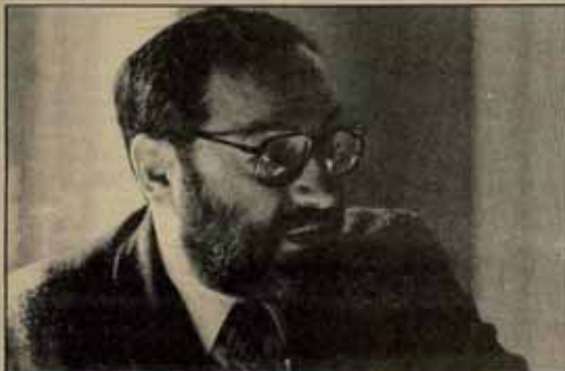
Umberto Eco vino a presentar su novela y a grabar en TVE.