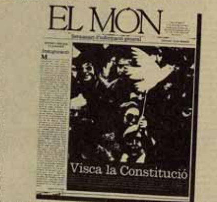
El 11 de diciembre del 81 sale el nº 6 de El Món. Corta vida de del semanario catalán.

Esta no correspondencia entre la voluntad normalizadora y la autonomía del mundo de la prensa conlleva asimismo un peligro inherente a toda la cultura catalana: el envanecimiento, el encerrarse en ámbitos específicos y responder a la discriminación con la subcompensación en el "ghetto". Se trataba del san traido y llevado "provincionalismo", un peligro real que ha sido denunciado estos días en el ciclo que sobre la cultura catalana se está celebrando en Barcelona. Lo que uno de los ponentes —miembro del equipo de la revista "Els Marges"— que hace un par de años formuló la posible desaparición del catalán en caso de proseguir la hegemonía del castellano en los medios de difusión masiva —plasmó abruptamente diciendo que no habría normalización de la lengua y de la cultura