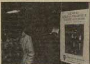
Las Jornadas despertaron interés.

Pero el problema siempre más de fondo era que en todo el debate se había olvidado la construcción de un movimiento de mujeres autónomas, que se consideraba la base de cualquier política para las mujeres, así como la línea general para la conquista de derechos y reivindicaciones, máxime cuando la crisis económica hace prever que no se va a tener muchas iniciativas sobre cuestiones