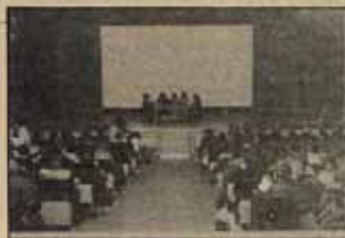
Un momento del debate en el Pleno.

En el primer punto de debate teórico sobre definición de la corriente, se presentó la ponencia "Reflexiones para un feminismo crítico" por parte de un Colectivo de mujeres que en su mayoría habían pertenecido al Frente de Mujeres Feministas de Madrid. En la ponencia se defende la necesidad de definir una nueva teoría feminista que trate de analizar la opresión de las mujeres a través de una síntesis entre la