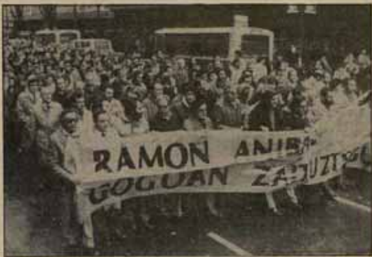
La clase obrera vasca tiene derecho a mostrar su indignación.