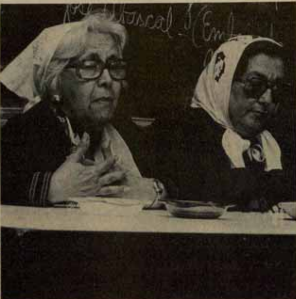
Las Madres en la reunión con los exiliados argentinos en Madrid

Las Madres son muy duras con los partidos políticos tradicionales, denunciando la timidez que mantienen a la hora de pedir responsabilidades a los militares. También son muy críticas con las Iglesias católica y judía, que "no han pasado de las declaraciones". Incluso hoy, dos desaparecidos, luego reaparecidos, que han muchos testigos que vieron personalmente a Monsiñer Antonio Pla-