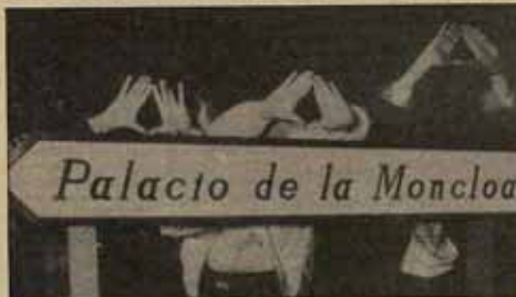
Texto entregado en el Palacio de la Moncloa

Interpretamos que esta negativa, máxime habiendo recibido el Presidente González a representantes de sectores que niegan el derecho al aborto, es una vez más no tener en cuenta las exigencias de las mujeres ni al movimiento feminista. Y ello tratándose de un tema de vital importancia para nosotros como es el derecho al aborto. □