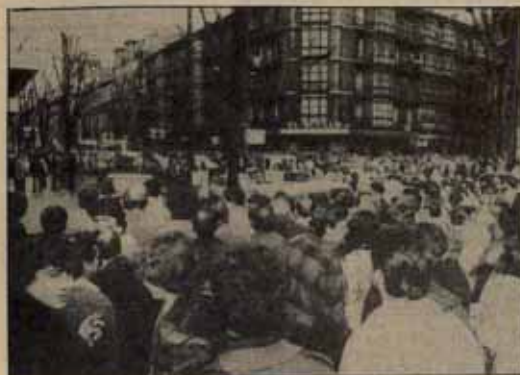
Concentración ante el lugar del atentado.