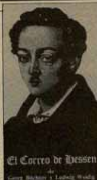
El Correo de Hessen de Georg Büchner y Ludwig Wislag

El panfleto de Büchner —marcado por la ilustración, editado por Siles-Simon, marxista y republicano radical— escrita en 1835, cuatro años antes que el Manifiesto Comunista, al que siendo crítico consciente, al día siguiente una crítica de éste a la esencia tras, pero sobre los cuales jamás podrá levantarse una firme batalla en pro