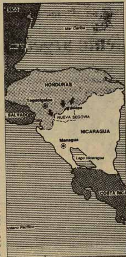
Frontera entre Honduras y Nicaragua, en la que la presencia de Nueva Segovia es la más afectada por las incursiones somocistas.

Nos marchamos cuando cayó la noche. Cuando llegamos a Tegucigalpa, los periodistas publicaban un comunicado del ministro de Asuntos Exteriores diciendo que no existían y nunca habían existido bases contrarrevolucionarias en Honduras.