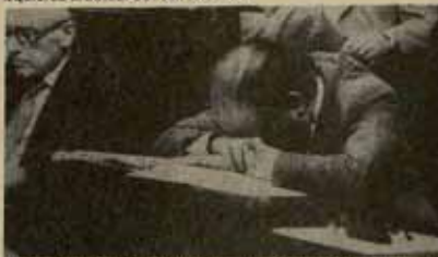
Pesa a sus declaraciones optimistas, el President no le tiene nada claro.

Con un 31% de los diputados de la cámara catalana, y gracias a hasta ahora incondicional apoyo de Esquerra Republicana y Centristes-UCD, el gobierno inusual de Convergència i Unió cumple sus primeros mil días en una situación de precariedad caracterizada por su falta de correspondencia con el "país real" tras la victoria socialista el 28-O, la crisis o disgregación de sus aliados (ERC, CC-UCD, CDS...) y la falta de voluntad del PSC-PSOE para configurar una alternativa de izquierda al actual Consell Executiu.