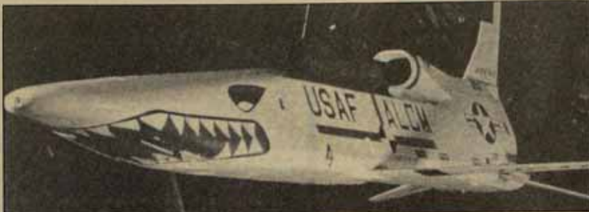
Un misil Cruise, fabricado para agosto.

En la práctica, esto lleva a las fuerzas de la END a alinearse con el ala derecha del movimiento antiguerra, en torno a las cuestiones fundamentales. Por ejemplo, la Campaña Británica por el Desarme