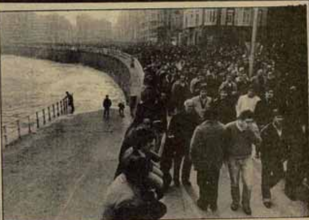
Aspecto de la impresionante manifestación que recorrió las calles de Gijón el día de la Huelga General (Reportaje, en páginas 13 y 16).