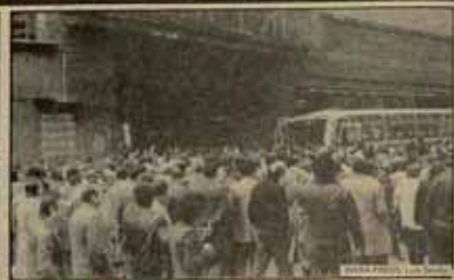
San José de la mañana. La columna de manifestantes que recogió a los trabajadores de Talleres de Mondo y a los vecinos del barrio de Pomarín cuando la estación de autobuses ALSA, que pertenecía al grupo del resto de Asturias.