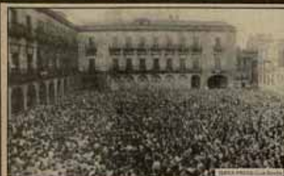
En la fotografía de la izquierda un repente de la Plaza del Ayuntamiento, repeta de gente. Pero este una parte muy pequeña de la plaza. En la fotografía del centro, tomada exactamente a la misma hora que la de la izquierda, se puede observar un inmenso grupo de trabajadores y niñas del mar que no pudieron entrar en la plaza. Otra parte estaba en las calles adyacentes.