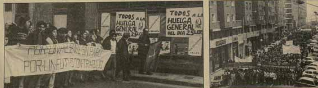
Jovenísima socialista con una pancarta en la que se puede leer: "POR UN PRESENTE SIN PARO, POR UN FUTURO CON TRABAJO" encabezan un cortejo de manifestantes. "¡DÓNDE ESTÁ EL CAMBIO! MATARILE, RILE, RILE..." cantaban después junto a los trabajadores de Talleres de Moreda