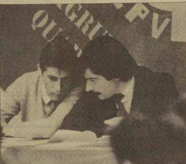
Para la dirección del PCE lo que hay que hacer es sólo un examen concreto de las insuficiencias y los fallos en métodos y personas. En la fotografía José Galán y Gerardo Iglesias, secretario general del PCE

casos del fracaso electoral del PCE —ver Combate n.º 288— el Documento del MRPC continúa afirmando que las referencias a la legalización del PCE, hicieron mucho miedo a un partido que no quería volver al agujero y toda nuestra moderación y conjeturas al primer "error", no nos salvaron sino no desestabilizar. Ahora habla que sacar votos, y además de caer en concepciones ideológicas de la política, tenemos que cometer el "error" de desmantelar al partido con apresuradas medidas organizativas para un partido pensado para hacer campañas electorales y no para dirigir movimientos de masas. «Un partido desmantelado en el trabajo en las instituciones» como dice el documento, ha sido siempre una forma de definir a un partido reformista.