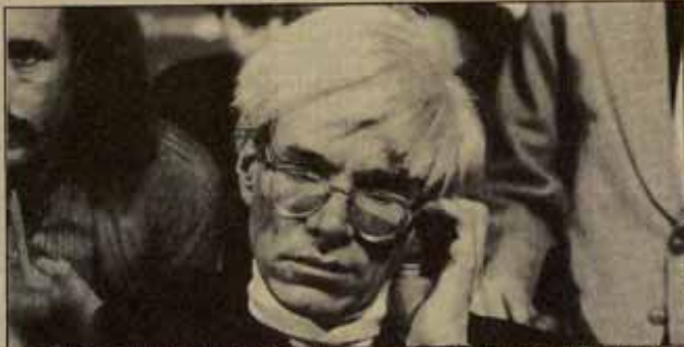
Andy Warhol, en las rutilantes sesenta, fue un artista que, antes de tener del todo clara su filosofía, empezó a ejercer gran influencia sobre los artistas de las generaciones siguientes.

Ya hace veinte años, un crítico americano, Larry Bell, llamó a Warhol como ejemplo de artista que, antes de tener del todo clara su filosofía sobre el arte, empezó a ejercer gran influencia sobre los artistas de generaciones siguientes. Hoy, Andy Warhol ha conseguido darle a su filosofía forma de libro, y como éste está traducido al castellano, es divertido, contiene sabias reflexiones y muchos consejos útiles para la vida diaria, pensó que todo el mundo debería leerlo. A muchos personas les ayudará a hacerse nuevas preguntas a sí mismos.