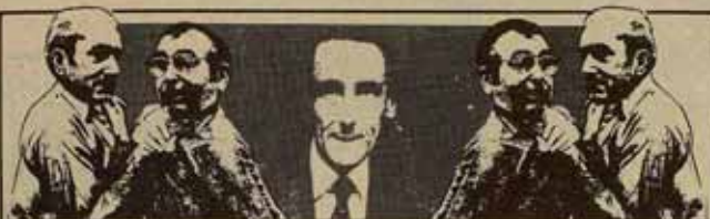
HAY QUE PASAR A LA ACCIÓN