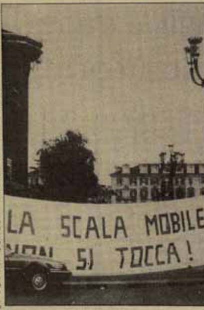
«La escala móvil no se toca». Plaza Cavour de Turín.

La cosa colmó el vaso. La reacción obrera fue inmediata. En Milán el 6 de enero se produjeron una huelga general de dos horas, con una manifestación en la que participaron 50.000 personas. Ese mismo día, en Génova, Venecia, Nápoles, Florencia y Palermo, decenas de miles de trabajadores salieron a la calle, en muchas ocasiones a pesar de las consignas de las direcciones sindicales, y ocuparon durante horas las carreteras, aeropuertos, estaciones y vías férreas. En Roma hubo violencia.