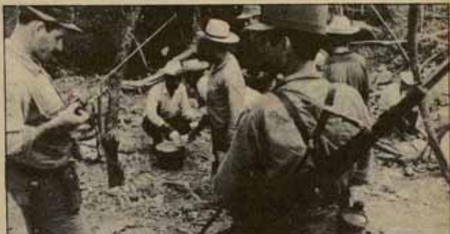
Mientras se celebra la cumbre de los No Alineados en Managua, en la frontera con Honduras se intensifican los ataques.

Todo ello no sería así si no existiera el movimiento antiguerra, masivo y multitudinario, que ha demostrado su combatividad y capacidad de movilización en los dos últimos años. Este movimiento no debe esperar nada de las negociaciones de Ginebra, con sus ofertas y contraofertas, con sus alianzas y contraalianzas diplomáticas, de las que tendremos mucho en los próximos meses. Debe seguir con su movilización, independientemente de los gobiernos y de las mesas de negociación, exigiendo la retirada y el desmantelamiento de todos los misiles de uso europeo. □