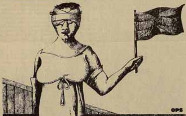
formaba parte de ese marco de vida sacrificadora.

te "inicio de diálogo", pues aunque la oferta se realice en términos de negociación, en realidad se trata de un primer escarceo para ponerse de acuerdo en si es posible llegar siquiera a sentarse en una mesa.