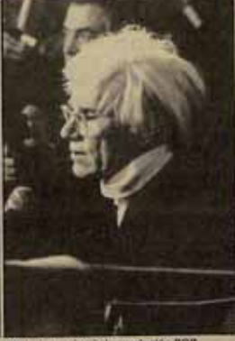
Su rueda de prensa en Madrid fue multitudinaria. Forma parte de sus últimas obras.