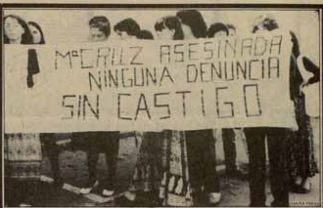
La ley exige que la mujer entregue su vida ante el violador armado para demostrar que no desea ser violada

"Mujer, si decides abortar tenemos direcciones de Inglaterra, Holanda, Alemania y otros países. Contacta con nosotras!"