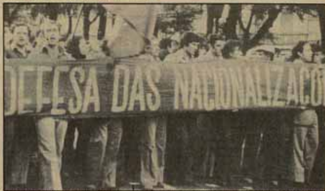
Los resultados de las recientes elecciones autárquicas iban a influir fuertemente en la crisis de AD. Los partidos de izquierda ganaron.

Y puesto que la solidaridad en para ellos, es hora ya de que el gobierno socialista "haga algo". La jornada internacional de solidaridad con el pueblo salvadoreño, convocada para este viernes 22, sería una buena ocasión para ello. □