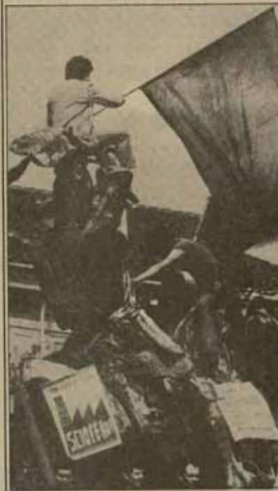
Los trabajadores italianos están haciendo estremecerse al gobierno Fanfani.

Si el día 20 no se ha llegado a ningún acuerdo, el gobierno Fanfani dictará las medidas por decreto. La patronal y el gobierno están dispuestos a sacar estas medidas adelante. El PCI se va a oponer a ellas en el parlamento y los sindicatos han convocado una huelga general el 18 de enero. Los trabajadores ya han comenzado a salir a la calle. Como consecuencia de todo ello, el gobierno Fanfani puede caer: ha ganado una votación en el parlamento por un sólo voto, pero está en manos de los trabajadores que la crisis política se traduce al terreno social y se añade también con un proceso de la patronal.