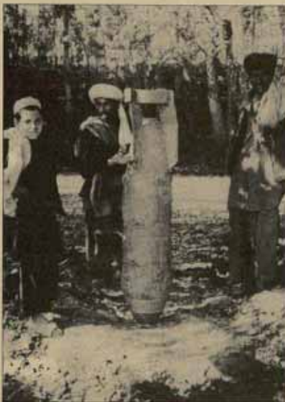
La solución del "problema afgano" dependerá finalmente de la presión que haga la URSS por retirarse.

Esto ya es más de lo necesario para buscar una salida "honrosa". Pero ¿cómo? Lo más difícil no se sitúa en el plano internacional. Pese a todo lo que se haya dicho al respecto, la burguesía imperialista no está muy interesada en que Afganistán, entre en su zona de influencia. Pakistán está inquieto ante una residencia afgana que no controla, y esta guerra traba el arreglo de su contencioso con la India. China, que hurgaba en Afganistán como en una herida en el flanco de la URSS, busca ahora activamente un acuerdo con Moscú, que puede que ya está más avanzado de lo que dejan entrever las informaciones. Quedan los propios afganos, y esa es la cuestión. Karmal y sus escuadra partidarios saben que, para la burocracia, los servicios locales no valen mucho cuando ya no lo necesitan de inmediato, los abandonan o se les lleva a