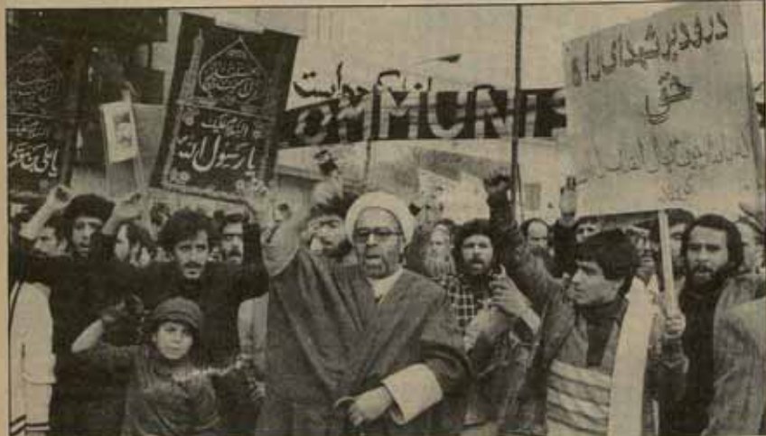
«No cabe duda de que Hussein desencadenó esta guerra con apoyos reaccionarios, con el fin de debilitar la revolución iraní y disipar las amenazas que comportaba para sus intereses en Oriente Medio».