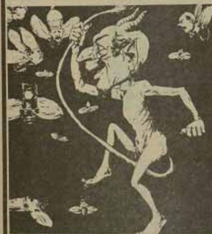
El Símion anarquista clama por el reconocimiento de Israel, contra el aborto y el amor fuera del matrimonio — esto también bastaría — dice.

Fundando anarquista — publica el comunismo libertario de "Mastenea feor". — Arrabal, en su afán de convertirse en el campo del espectáculo a cualquier precio,