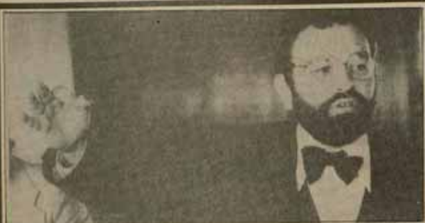
Arrabal reivindica para los anarquistas el derecho a que se les aparezca la vigena.