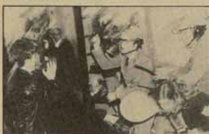
La policía en Euskadi protagonizó varias ocupaciones de Ayuntamientos con destrozos de mobiliario y protagonizó la famosa sustracción de existencias de un comercio. Pero sobre todo su participación en hechos sangrientos ha creado en los pueblos un permanente clima de enfrentamiento.

mentos policiales, su intrusión en bares y lugares de esparcimiento sin previo aviso, etc., han creado en estos pueblos un permanente clima de enfrentamiento y distorsión de la vida ciudadana. Por eso, el día en que la Policía Nacional abandonó Rentería hubo una fiesta general en el pueblo, y la alegría se extendió sin dudar a los conserjeros de los partidos socialista y comunista, porque reconocían que era lo mejor. Desde entonces nadie ha echado en falta el que la policía no esté ubicada en estas ciudades. Si ésta vuelve se habrá dado un paso represivo y antipopular.