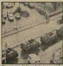
Tanquetas de la policía recorren los pueblos.