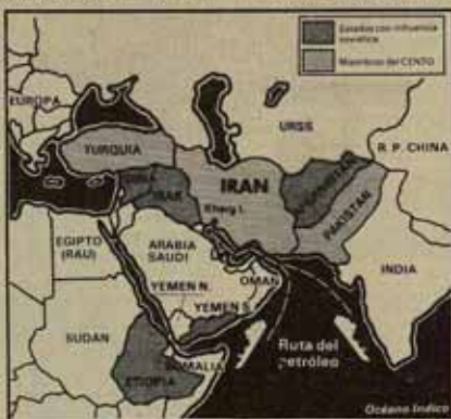
Cuando Irak atacó la revolución iraní ya no era un movimiento de masas oprimidas bajo la dirección de Jomeini, sino un movimiento de masas oprimidas.

Por otro lado, pensar que el régimen de Saddam Hussein aspiraría a afirmar que pretendía extender el sistema revolucionario a toda la región. Ha intentado utilizar el descontento masivo en Irak contra Saddam Hussein, hasta cierto punto, pero se ha cuidado muy mucho de no ir tan lejos como para favorecer un ascenso de masas que podría haber adquirido