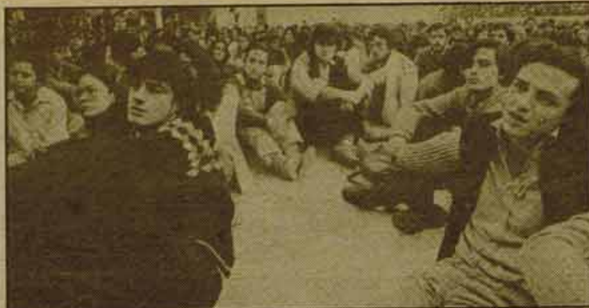
El día 12, estudiantes de las tres universidades madrileñas se reunieron en Asamblea General.

Fundamentalmente, sus posiciones defienden la autonomía de las Universidades en el terreno financiero y ligado a las comunidades a las que están vinculadas, autonomía en la contratación de profesorado, cubriendo las plazas de profesorado con criterios independientes en cada Facultad. Defiende la democratización profunda de todos los órganos de gobierno. Tiene sus límites. La lucha contra la selectividad es afrontada de forma ambigua: "Todos los que hayan pasado los exámenes de COU tienen derecho a la entrada en la Universi-