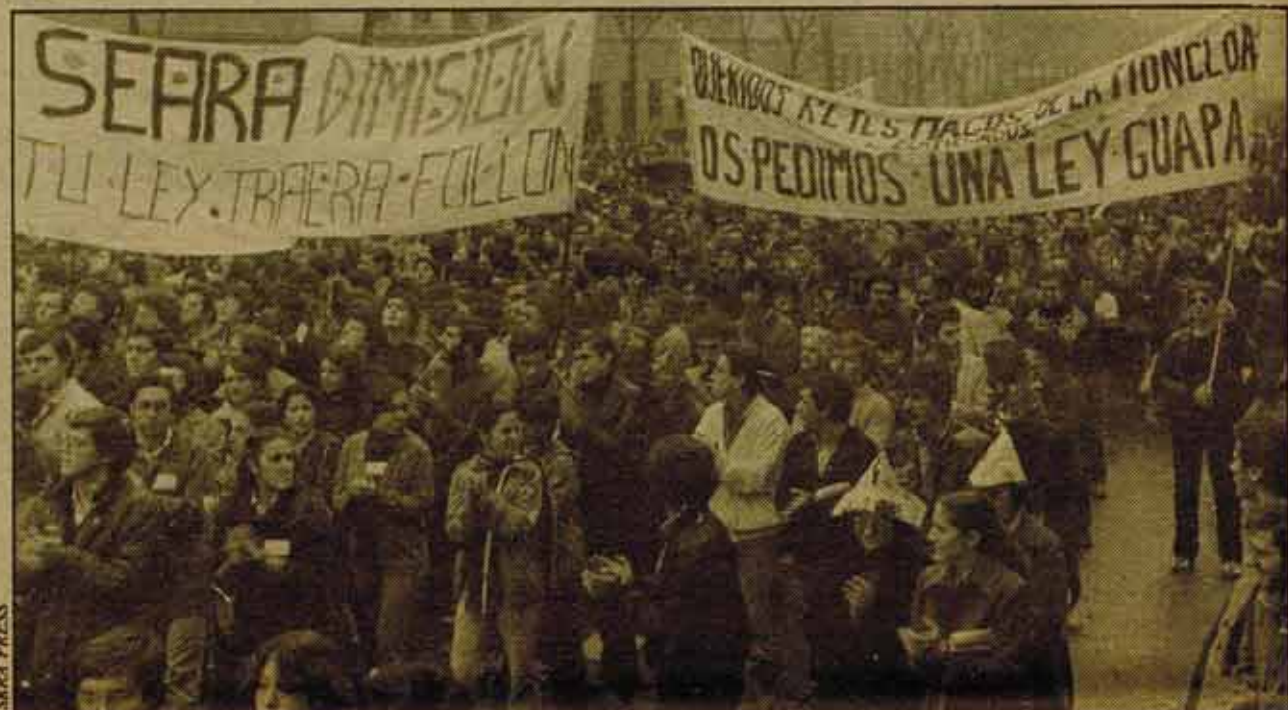
Por la mañana fueron más de 100.000 los estudiantes que salieron a la calle contra el Proyecto de Ley de Autonomía Universitaria y el de Estatuto de Centros Docentes. La mayor manifestación estudiantil conocida en Madrid, marcaba ya, definitivamente, el nuevo resurgir de la juventud escolarizada en lucha contra el Gobierno y los proyectos capitalistas. Su unidad y confluencia con el movimiento obrero era más que posible.