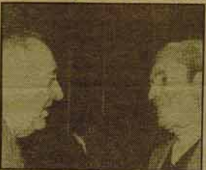
¿No es enternecedora la sonrisa de Camacho al ministro del Interior? El día anterior tuvo que correr para refugiarse de sus botes de humo y dos compañeros caían muertos.

Congreso por el acuerdo PSOE-UCD, al final, quizá no demasiado tarde, quizá sí, han accedido a discutir y hacer un acuerdo con el Partido Comunista para enmendar el Estatuto de los Trabajadores". Más claro, el agua. Las luchas eran para permitirle al PC entrar en la negociación como interlocutor válido y no para echar abajo el Estatuto de UCD.