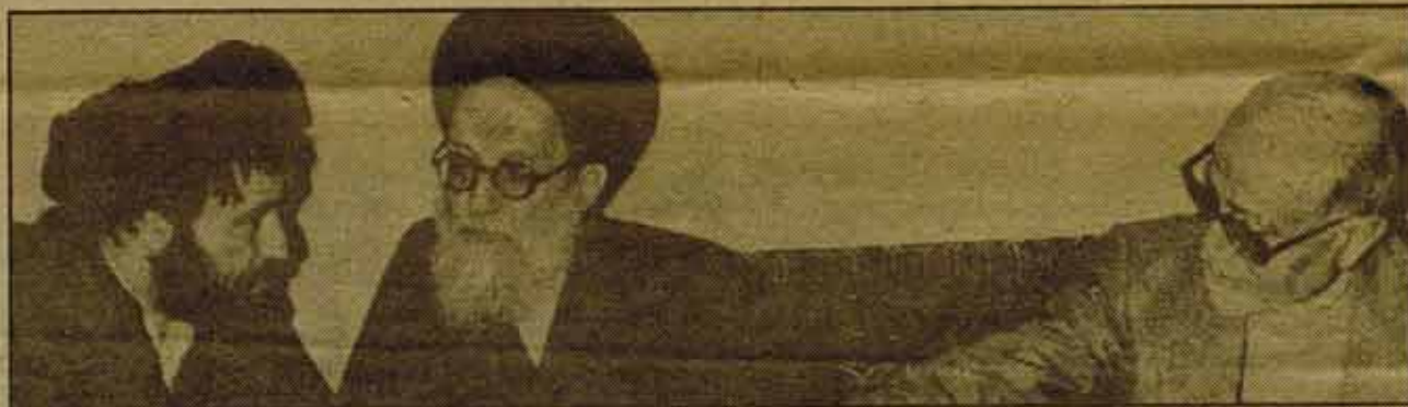
El hijo de Jomeini, el ayatollah Chariat-Madari y el ex-primer ministro Bazargan se entrevistan en Qom en un intento de dar solución a la crisis de Tabriz.

Pero el Bazaar (la pequeña burguesía comercial que controla el 70% de la importación-exportación del país, fuertemente ligada al campesinado rico y en cuyas manufacturas trabajan casi tres de cada cuatro obreros iraníes) no es el único componente social, aunque hasta ahora sí el determinante, de la "Revolución Islámica". Los funcionarios del aparato de estado, el sector intelectual, configuran, junto al clero chiíta, capas sociales con intereses. Y además hay que sumar las presiones que ejercen tanto la clase obrera, con su dinámica propia, como los "desheredados". El papel de Jomeini ha sido esencial tras la caída del Sha para reconstruir y mantener el carácter burgués del Estado, situándolo, a la vez, fuera del objetivo de las movilizaciones de masas. Pero como las declaraciones de Bani Sadr y de otros miembros del Consejo de la Revolución han revelado, el equilibrio bonapartista impuesto por el Iman no evita que cada una de las fracciones de la burguesía reaccione frente a los problemas políticos, y frente a la presión de las masas, de acuerdo con sus propios intereses. El carácter de las autonomías, la política económica, la misma concretización de las formas de Estado están todavía sin decidir en una buena parte, a pesar de la votación de la Constitución Islámica.