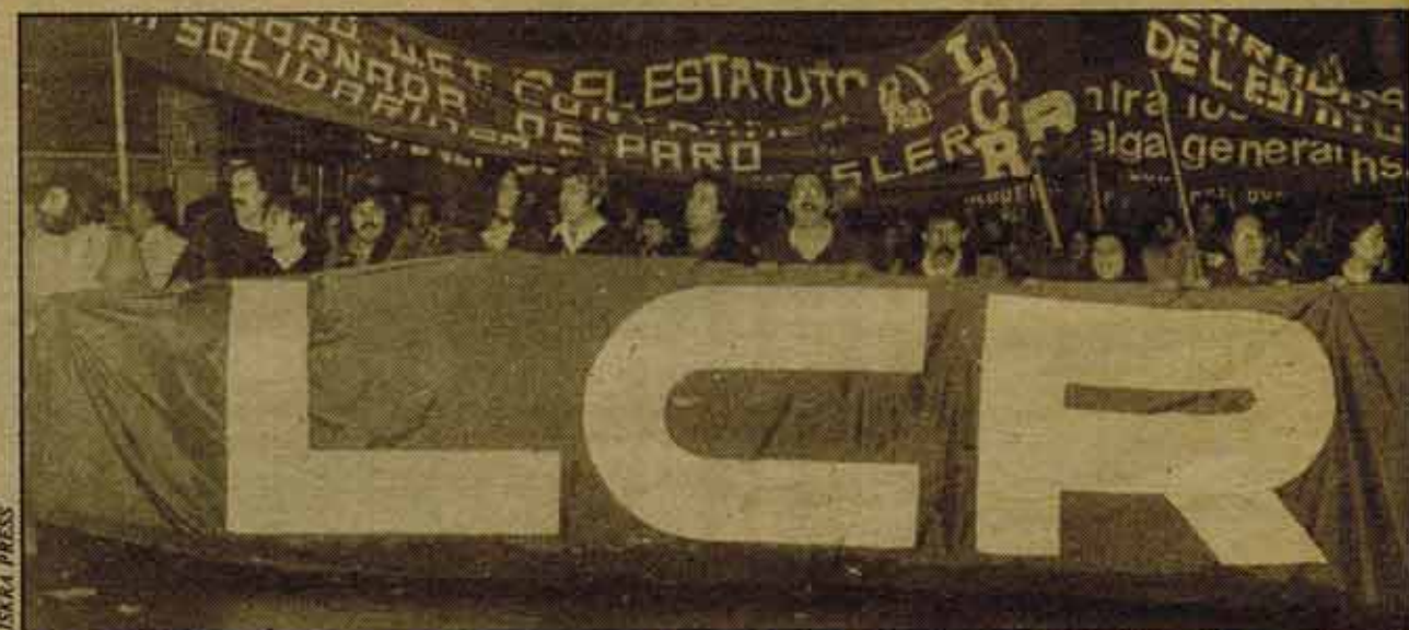
Por la tarde fueron 300.000 en manifestación contra el Estatuto de los Trabajadores de UCD-CEOE. En la manifestación participaron miles de estudiantes. Fue una marcha dinámica, las consignas no cesaron de corearse; trabajadores y estudiantes sentían juntos, unidos, su fuerza, la capacidad para echar abajo los proyectos del Gobierno. En la foto la cabeza del cortejo de nuestro partido, que congregó a más de 2.000 personas.

La indignación contra la actuación de la policía creció inmediata y espontáneamente. Obreros y estudiantes, en la misma plaza de Embajadores y luego por los alrededores, expresaban su voluntad de responder duramente. Pero la dirección del PCE se empeñó en ceder a las acusaciones que los medios de comunicación burgueses comenzaron a montar contra ella y la dirección de CC.OO., tratando de responsabilizarlas hasta de las muertes mismas. El PCE sabe bien quiénes son los responsables de esas muertes: el Gobierno y la policía. Sabe también, por qué éstos montaron la campaña de presión sobre el PCE: para que dejara hasta las movilizaciones limitadas que estaba proponiendo y pasara a aceptar sin rechistar el Estatuto. El PCE sabe también las consecuencias que su actitud puede tener: la ruptura de la unidad forjada entre obreros y estudiantes, dejar las manos libres a que la represión sea un principio ante el que siempre haya que ceder en el futuro... aunque no se conquisten las reivindicaciones obreras.