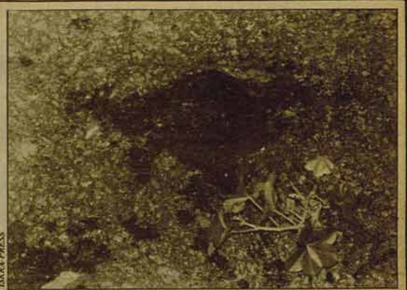
En el suelo, alguien ha depositado las primeras flores junto a la sangre de José Luis Montañés Gil. Tras una jornada en que obreros y estudiantes demostraron su fuerza en la calle, el Gobierno respondió con brutales cargas y tiros de la policía: era palpable que ya no le bastaba la "mayoría parlamentaria" de UCD para imponer sus Estatutos.