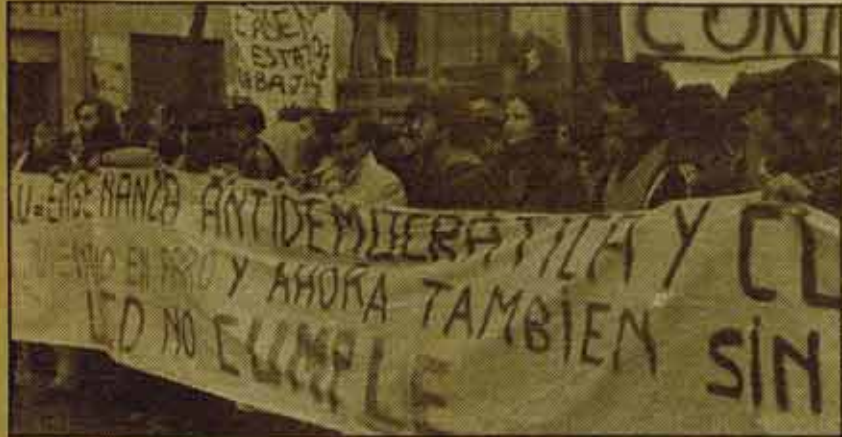
Un momento de la manifestación celebrada el día 13 por la mañana en Madrid. Se calcula en 100.000 los participantes.