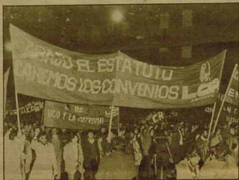
En la fotografía, una parte del cortejo de la LCR.

Así, ha pasado que los afiliados a UGT han participado activamente en muchas de las huelgas y manifesta-