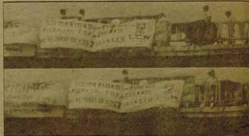
La policía introduce en el furgón a nuestros camaradas. Mientras las pancartas comienzan a ser retiradas.

Tenían clavada la espina. Entre el 26 de junio y el 8 de julio, la organización de LCR en Madrid había llenado calles, vallas y estaciones de "metro" con carteles de "solidaridad con Euskadi", había repartido octavillas, había pintado murales, había llevado propuestas en este sentido a los sindicatos obreros y organizaciones populares. Eso le sienta a la burguesía y a la policía mucho peor en Madrid que en cualquier otro sitio: tenían clavada la espina. Y querían quitársela.