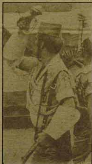
español de la IV Internacional, se niega a la continuación de la Legión en Fuerteventura. No pedimos su traslado, ni su integración en el Ejército. Queremos su inmediata disolución.

Por todo ello, la Liga Comunista Revolucionaria, sección en el estado