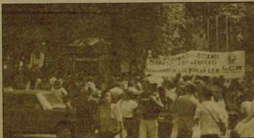
El domingo día 9, el Rastro madrileño fue el lugar elegido para uno de los puestos de reparto de octavillas que se instalaron en protesta por las detenciones.