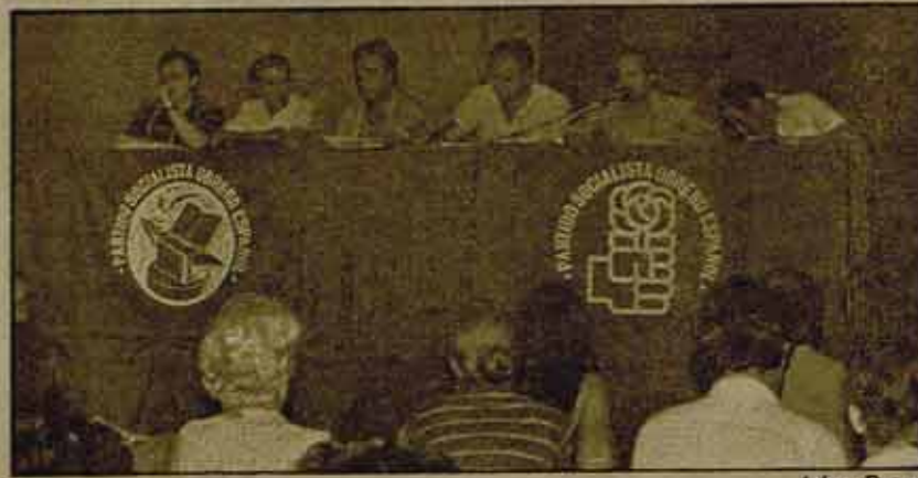
Conferencia de prensa de la "Izquierda Socialista". Sólo diferencias tácticas con Felipe.

Un periodista del semanario La Calle preguntó, extrañado, por qué se había omitido la referencia explícita al carácter marxista del PSOE. Se le respondió que ello ya estaba contenido en la declara-