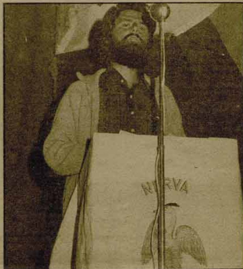
-De nuestras propuestas, se discutirá la elaboración de la carta municipal, el Estatuto de Autonomía de Andalucía, la reestructuración de las tasas impositivas y la solidaridad con Euskadi.

-En lo inmediato, ¿qué temas tiene planteado el próximo pleno?