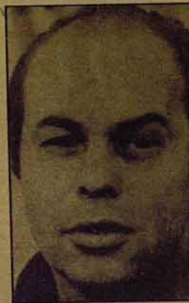
Jacek Kuron, miembro del KOR. Detenido.