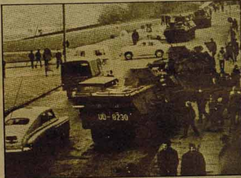
Tanques en SZCZECIN: la respuesta de los burócratas a la cólera obrera.

nivel de vida (aumento de precios, almacenes comerciales), cuando el suministro de productos alimentarios va deteriorándose, cuando, en fin, no se vislumbra la más leve perspectiva de mejora en la situación de los trabajadores ni en la de sus familias.