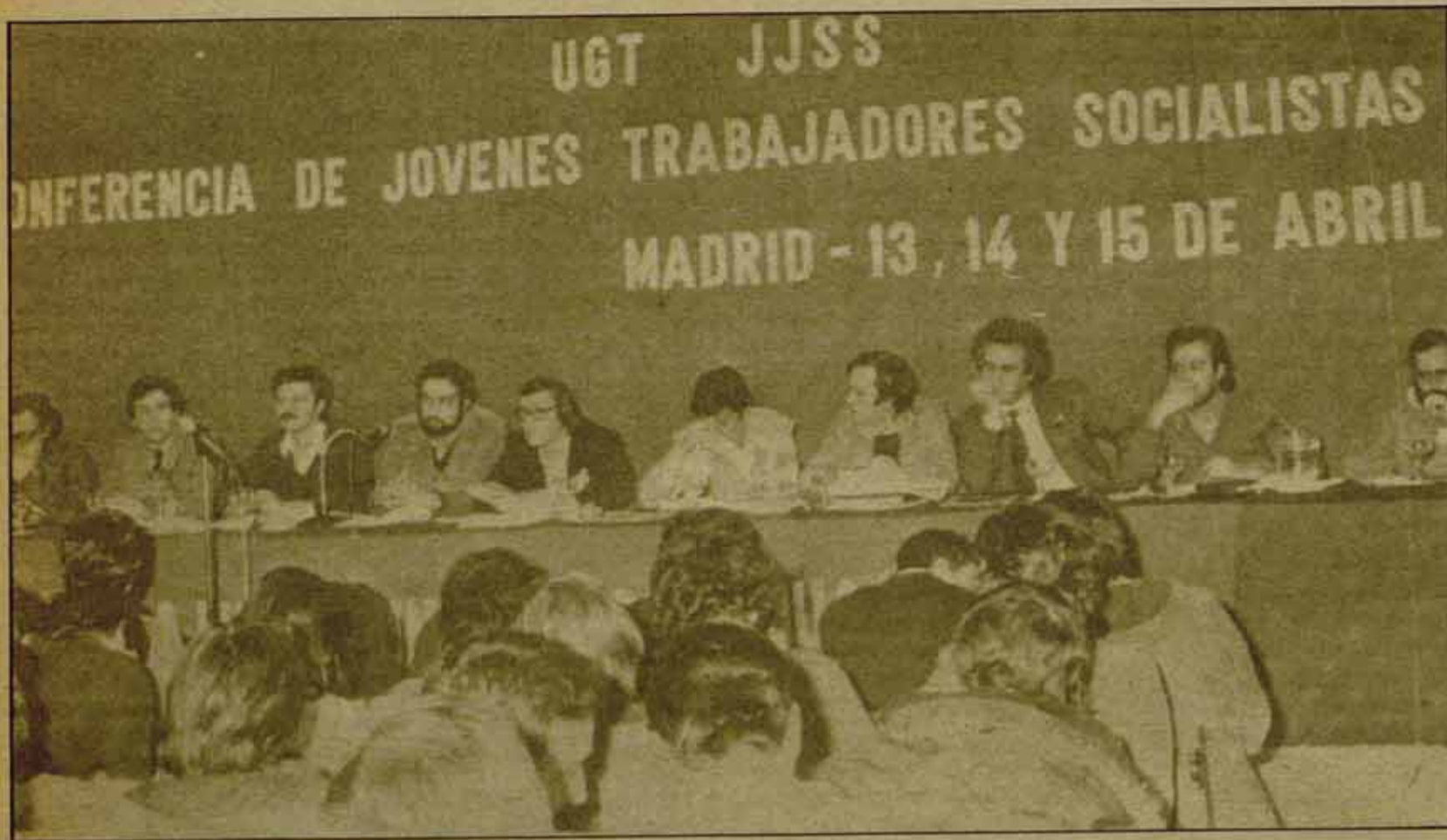
Conferencia de jóvenes trabajadores socialistas