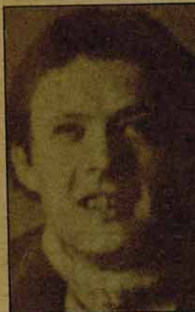
Adam Michnik, simpatizante del KOR. Detenido.