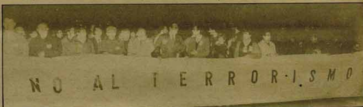
Y así, el terrorismo sigue.

mos el terrorismo, así no habrá golpistas y así se fortalecerá la democracia. Pues no, compañero Nazario. La causa del golpismo no es ETA. Quienes hicieron la Galaxia y las insubordinaciones eran fascistas y golpistas antes de que ETA actuara. Era y siguen siéndolo. Y la única forma de combatirlos se llama depurarlos y se llama ampliar las libertades y no apoyar medidas antiterroristas, y se llama unidad de los trabajadores y no pactos anti-ETA con UCD.