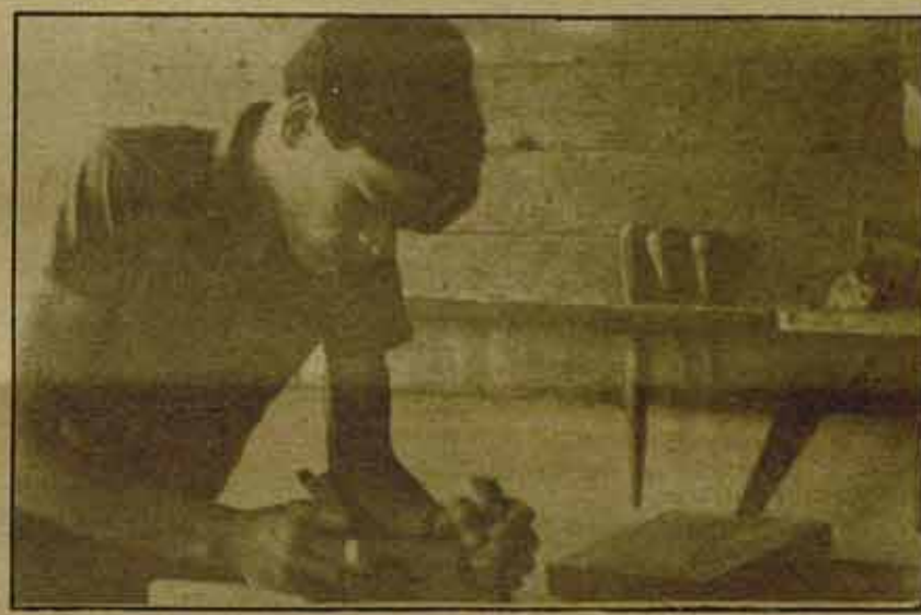
El paro y la formación profesional: aspectos importantes en nuestro programa.