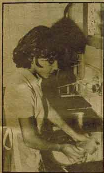
Familia y joven mujer: la opresión diaria.