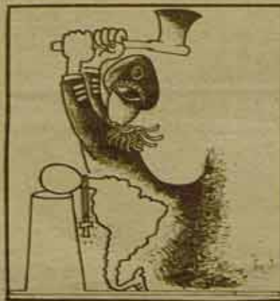
"Como una consecuencia de las actitudes reaccionarias, algunos miembros de los sectores dominantes pretenden, a veces, al uso de la fuerza para separar todo intento de reunión."

Todas estas críticas, todos los documentos que circularon en estos dos años han llevado a las autoridades eclesiásticas a amenazar la convivencia ciudadana allí