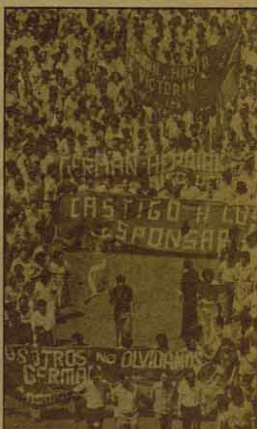
Pamplona, Málaga, Tenerife: depuración de todos los fascistas y golpistas del Ejército y las F.O.P.