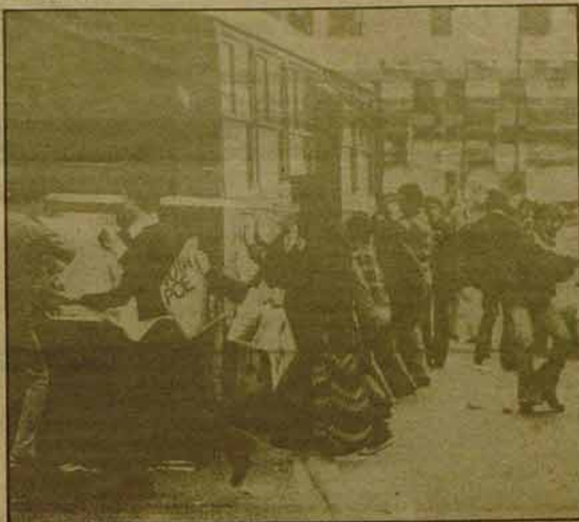
Unas nuevas elecciones darían resultados más favorables a los partidos obreros.

consenso, y no han tardado en dar al respecto sus opiniones, opiniones que no auguran nada bueno.