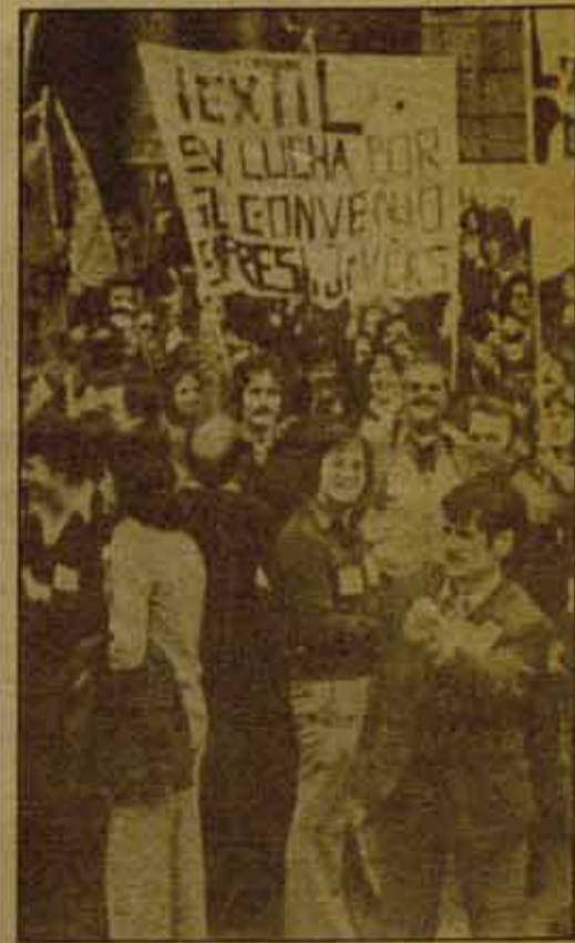
La defensa de los intereses de los trabajadores debe basarse en un CONVENIO MARCO DE MINIMOS.