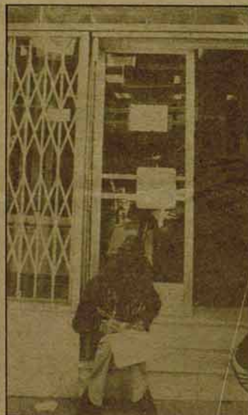
Ninguna flexibilización de plantilla, ningún "paro".