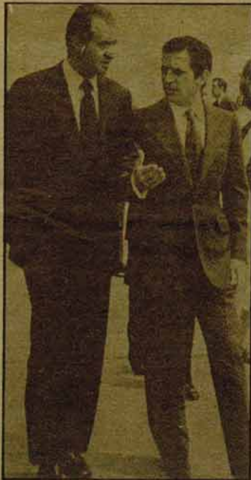
NO a la investidura de Suárez.

En los momentos actuales, es obligado moverse en el terreno de las hipótesis y la consideración de diversas alternativas posibles, porque no se conocen una serie de datos importantes para el futuro inmediato (en especial, el calendario político), y porque la propia inestabilidad de la situación podría verse agravada por factores imprevisibles (desde atentados terroristas de gravedad, hasta nuevos episodios del tipo "operación galaxia"...), que desviarán el curso más probable de los acontecimientos. En todo caso, hay que partir de establecer los problemas de fondo que tiene el país, que son quienes, a fin de cuentas, van a determinar las perspectivas de la situación.