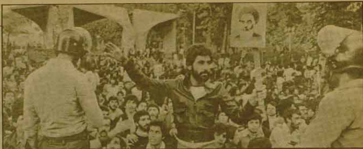
Irán/Los obreros del petróleo otra vez en huelga

Extractos de Perspectiva Mundial del 4-12-78.