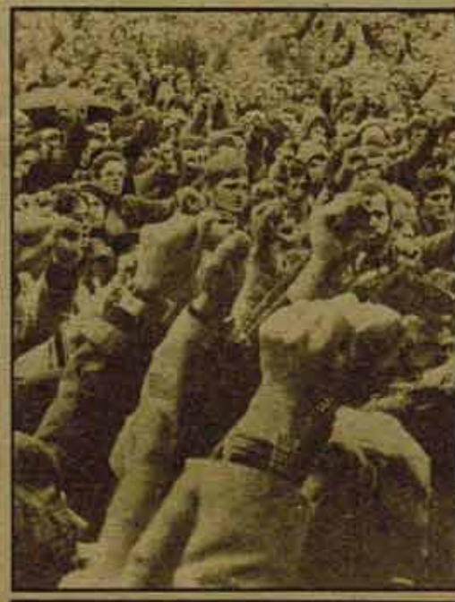
Un nuevo ascenso del movimiento obrero.

Así defenderemos la democracia frente a la reacción. ¿Pero, sólo hay que defenderla frente a la reacción? ¿Quién está ocultando la verdad sobre la operación Galaxia? ¿Quién ha implantado en Euskadi los "15 puntos"? ¿Quién, si se le deja, va a tratar de recordar sistemáticamente los derechos y libertades fundamentales? Pues el gobierno de la derecha, el gobierno UCD. Por eso para defender la democracia, para defender el pleno ejercicio de las libertades, hay que combatir a la vez contra UCD y la reacción.