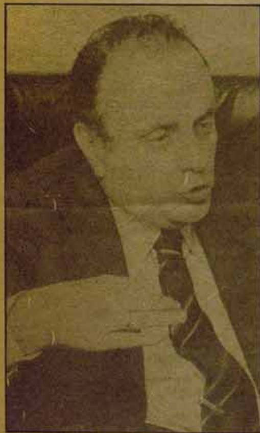
La cabeza visible del "Gobierno de salvación nacional".

Pero este proyecto ha quedado, prácticamente, invalidado tras el 6-D: el silencio actual del presidente y las especulaciones existentes sobre las distintas variantes posibles de calendario y alianzas políticas, reflejan un real desconcierto gubernamental, y la inexistencia de una alternativa claramente favorable a los