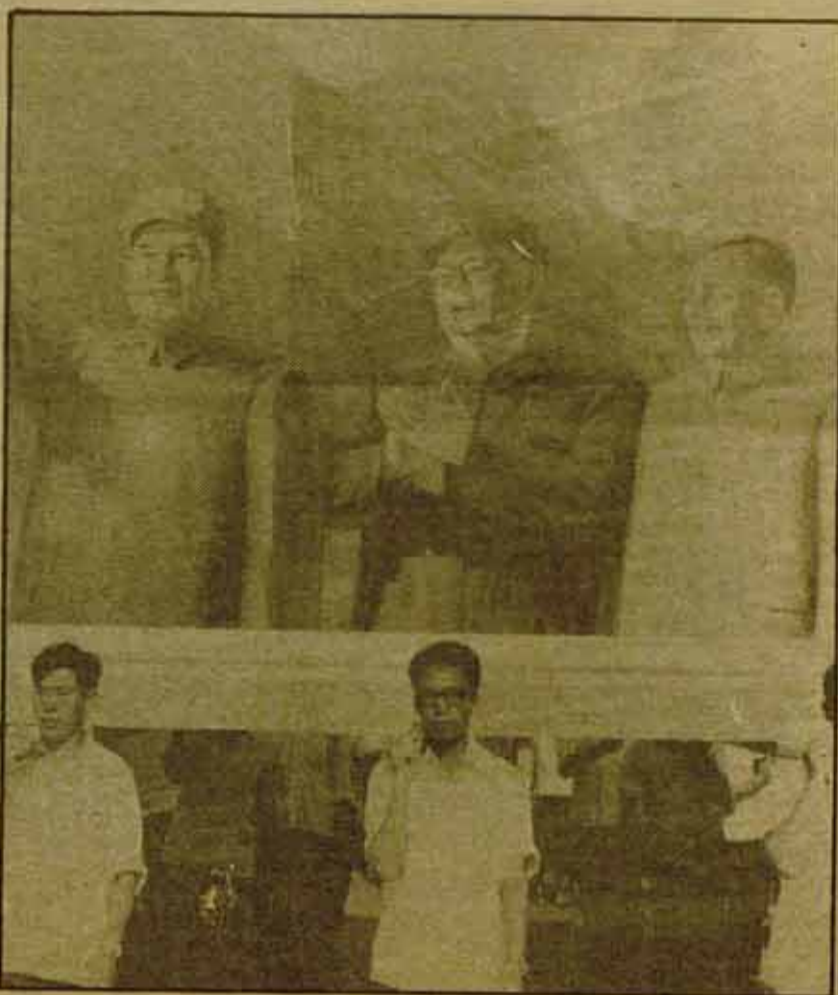
Cuatro, hoy de los Cinco, tras las acusaciones de complicidad contra el mismo Mao.

Pero a nivel popular, la rehabilitación de los manifestantes de Tien An Men, supone una condena abierta de la Revolución Cultural, dirigida por la fracción maoista, la Banda de los