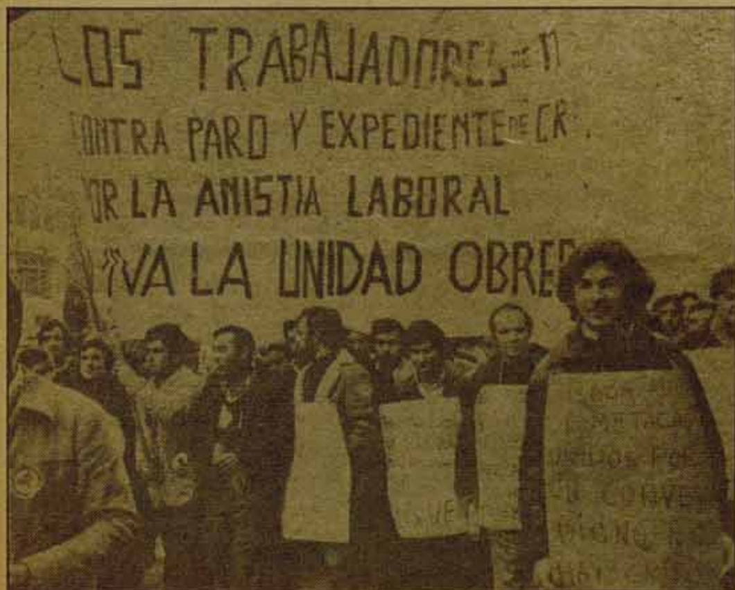
...Buscando siempre la unidad de los trabajadores, apoyando cualquier iniciativa de movilización de masas.

Es hora ya de romper el consenso, pero de romperlo de verdad. Y, para empezar, los diputados del PSOE y el PCE deben pronunciarse desde ahora mismo sobre cuál va a ser su voto ante la probable petición de investidura de Suárez. No hace ninguna falta esperar al