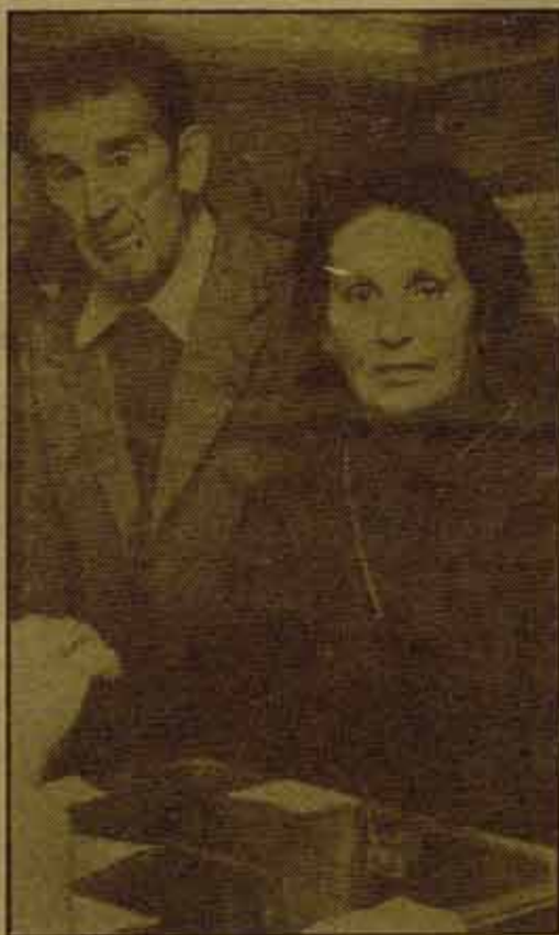
Elecciones municipales (ya) y generales inmediatamente después.