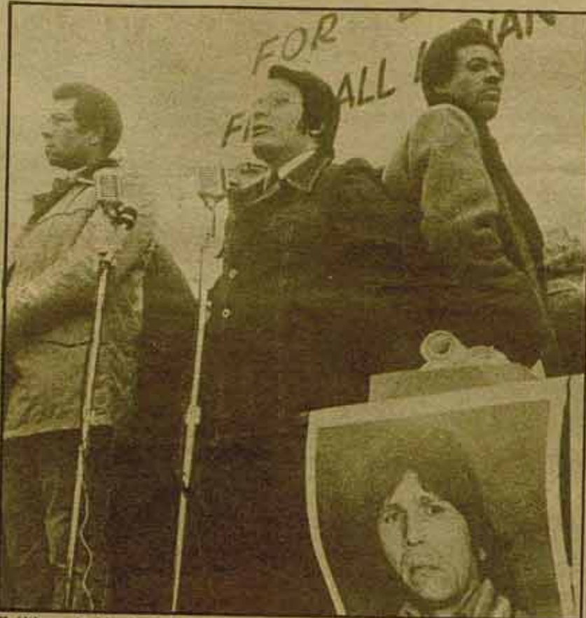
El último alcalde de San Francisco, Moscone, señaló su reconocimiento por el papel jugado por Jones en el Partido Demócrata al apoyarle en su candidatura a la alcaldía.

Por otra parte, el énfasis sobre el "marxismo" de Jones chocaba con su activa participación en el Partido Demócrata. El último alcalde de San Francisco, Moscone, señaló su reconocimiento por el papel jugado por Jones en