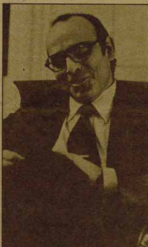
No hay pactos sociales "malos y buenos".