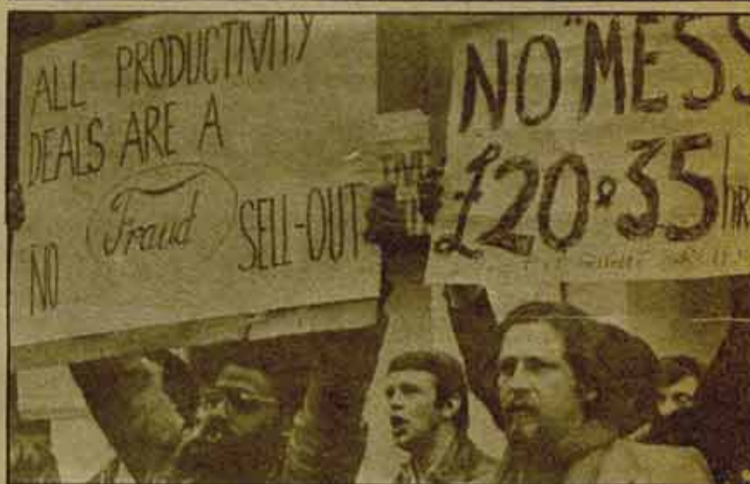
Las dificultades de los laboristas en Gran Bretaña. Austeridad; el fraude del capital.