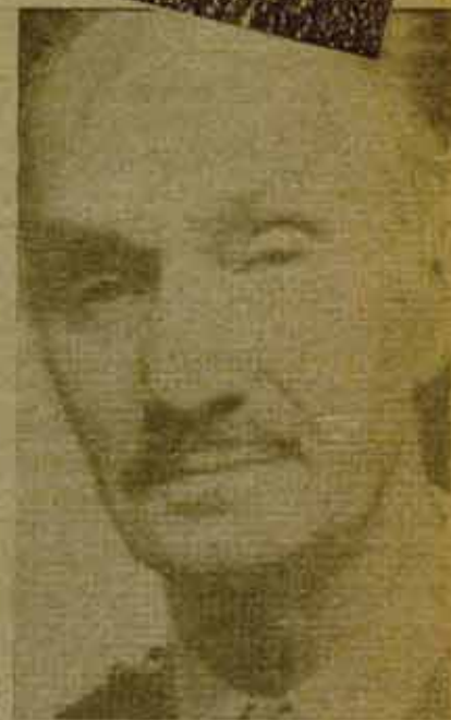
General Atarés Peña.