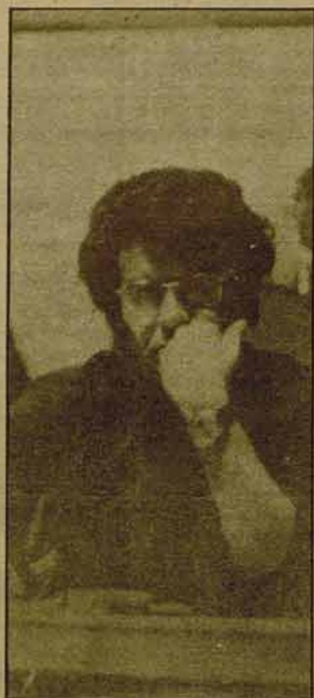
Alain Krivine, candidato para la LCR francesa.