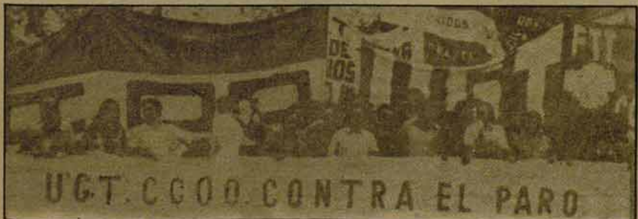
La lucha contra el paro es la lucha contra la "flexibilidad de plantillas".