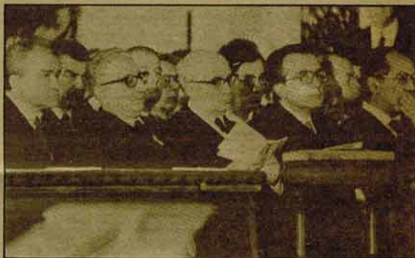
Ingrao, Leone, Fanfani, Andreotti, Cossiga. Llorando a Moro: sin él no hay compromiso posible.