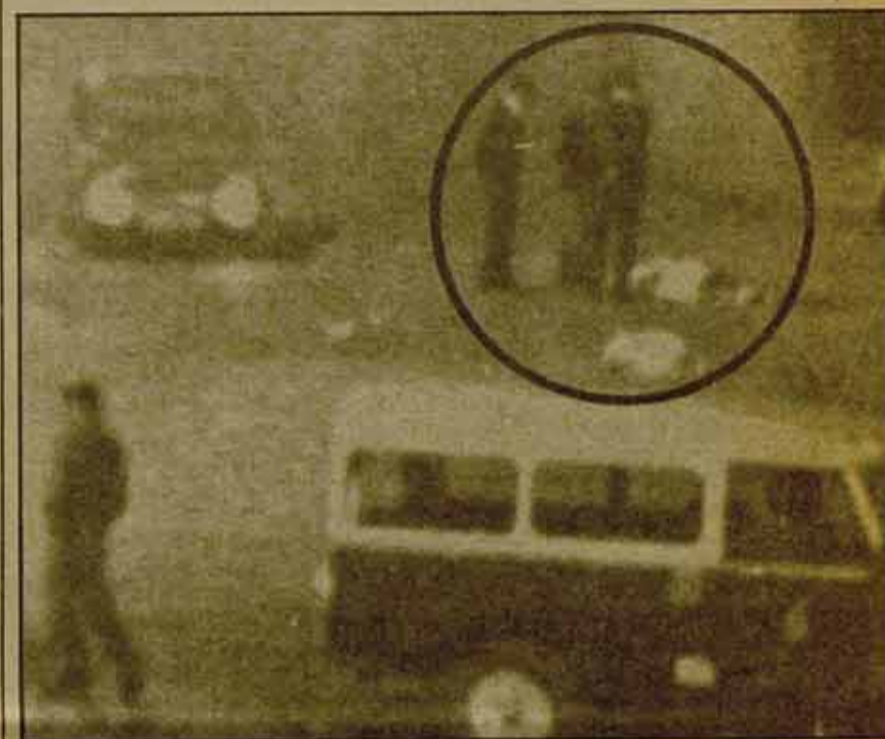
... La durísima ofensiva represiva desatada estas últimas semanas en Euskadi.

Ante ello, la Secretaría del Comité Nacional de Euskadi de L.K.I. (L.C.R.) hizo público el siguiente comunicado: