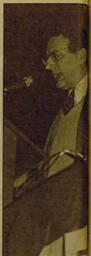
Ernest Mandel, candidato por LRI.

Europa que sería una "tercera fuerza" entre las dos "superpotencias". Este imperialismo no es mejor en nada que el imperialismo americano. Las multinacionales de origen y vocación europeas no desmerecen en nada a las multinacionales americanas o japonesas.