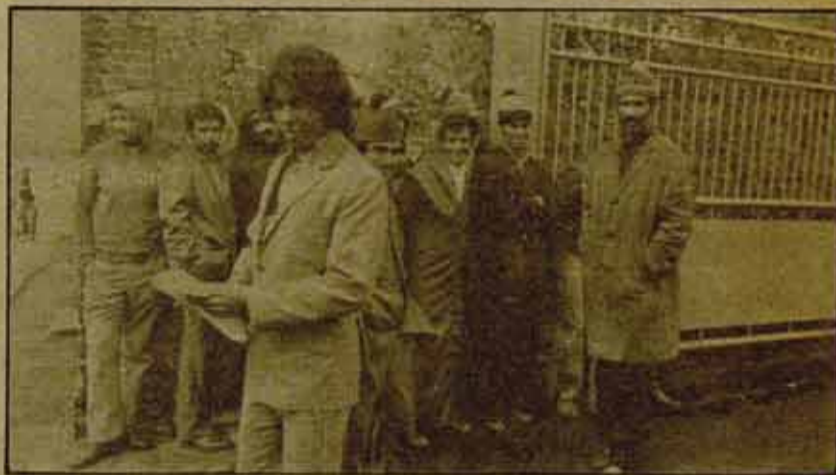
Trabajar sí, votar no. La emigración en Francia.