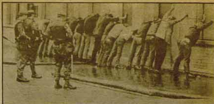
Irlanda del Norte: una forma de entender la unidad europea.

Rue de la Buanderie, 12-14, 1.000 Bruxelles (Bélgica) Tels.: 02 512 86 91 y 512 87 78