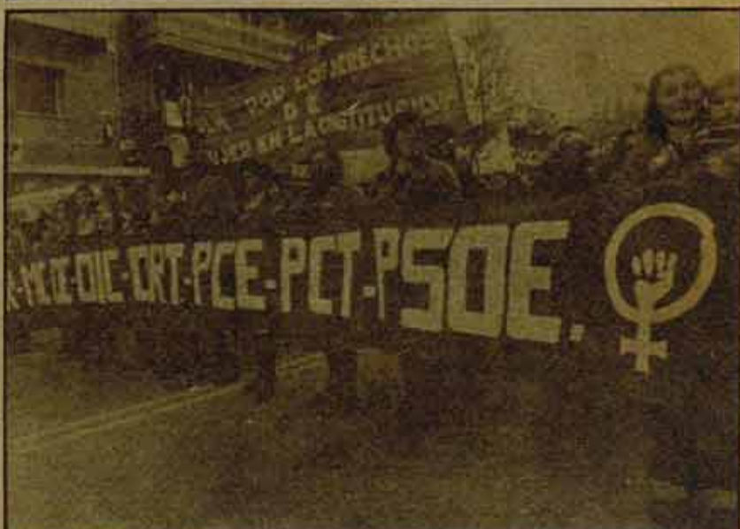
Sindicatos y feminismo. Apoyar las luchas de la mujer.