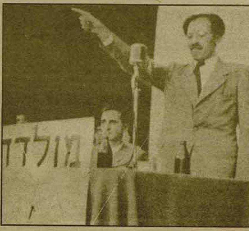
Begin / Mitin del grupo terrorista Irgun 1948.

Nace en la ciudad polaca de Brest-Litovsk el 16 de agosto de 1913 y desde su juventud forma parte del movimiento sionista BETAR. Durante la Segunda Guerra Mundial es detenido e internado en un campo de concentración soviético en Siberia, donde pasa los años 40 y 41. Un año más tarde aparece en Palestina, ocupada por los británicos. En el 43 es miembro fundador de una organización sionista terrorista IRGUN, que pretende expulsar a todo lo que suene árabe o palestino, con una línea abiertamente racista. La creación del llamado Estado de Israel en 1948, supone la expulsión y el genocidio de una gran parte de la población árabe palestina que habitaba en su territorio nacional; siem-