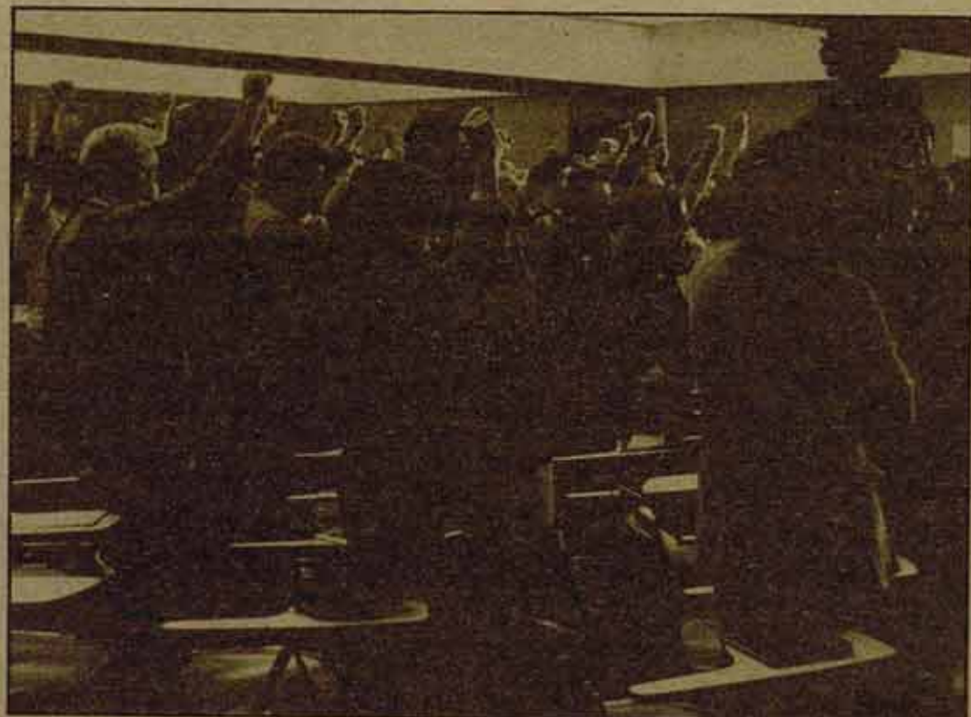
El Congreso, en silencio, recordando al compañero muerto en el atentado de "El País"

En cuanto a las delegaciones internacionales recibimos el saludo de Política Obrera de Argentina, el Partido Socialista de Chile/Coordinadora Nacional de Regionales, IEPALA, CORCI, Asociación de estudiantes Kurdos en Europa. También se recibió el saludo de la Asociación de familiares y amigos de Presos Políticos, el Centro de Mujeres de Vallecas, el Frente de Liberación Homosexual Gallego, los compañeros redactores del Viejo Topo.