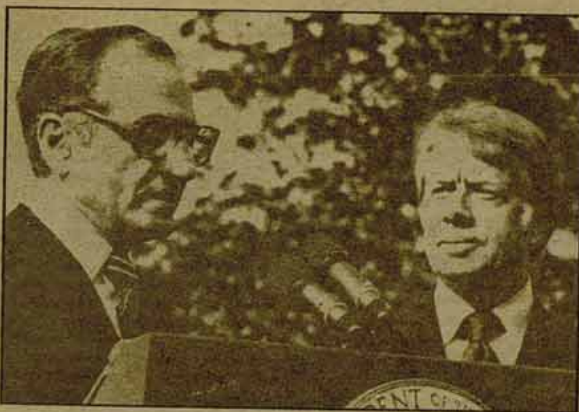
El imperialismo apadrina al Sha.

Las manifestaciones se reprodujeron el día 22 de octubre en la ciudad