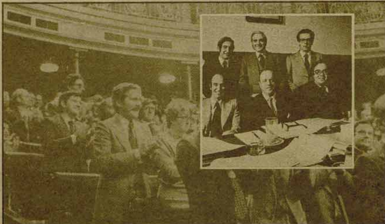
Consenso: desde la ponencia a los aplausos.

Sólo desde un punto de vista estrechamente parlamentario y aritmético puede justificarse el consenso por parte de estos partidos obreros. Pero esta política de conciliación desvirtúa la real correlación de fuerzas existentes entre la burguesía y la