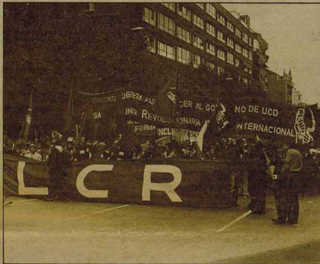
Vencer a UCD, preparar desde las luchas actuales la derrota del Gobierno.

se provocan contradicciones graves en el aparato de Estado, que añaden factores de inestabilidad a la situación.