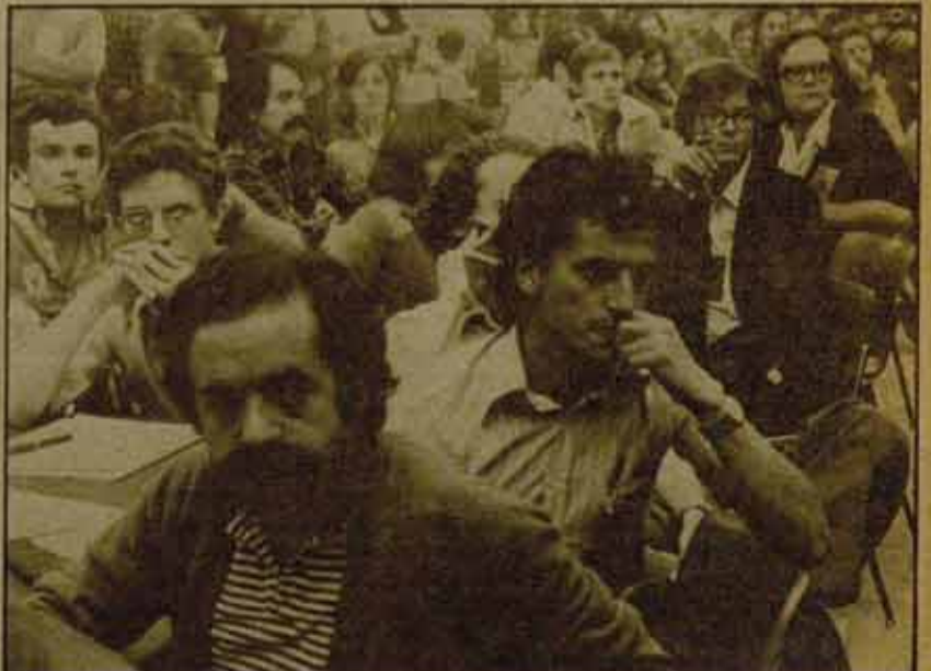
El debate de la tesis fue duro y tenso. Un sector de la delegación de Madrid que sigue con atención el debate.