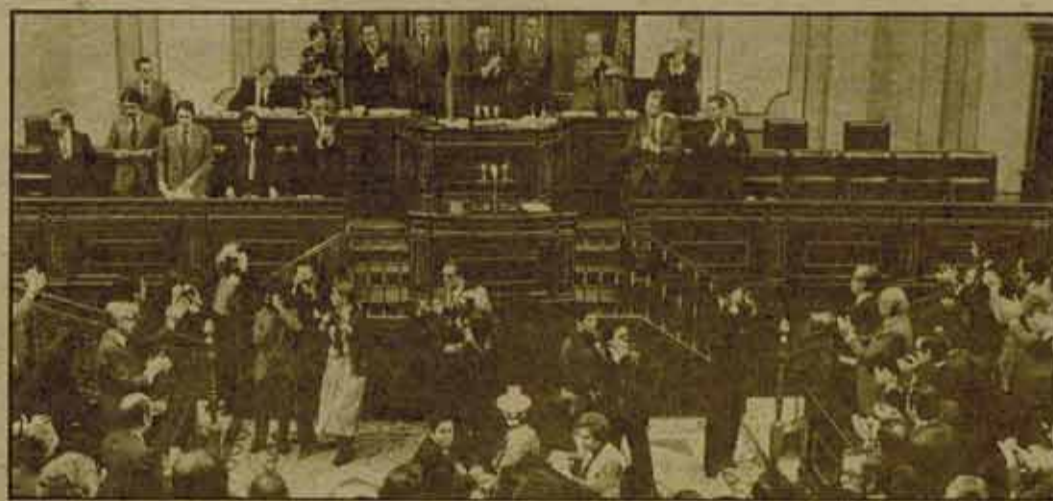
El Congreso aplaude la Constitución. Nuestra tarea es lograr hoy el máximo de NO en el referéndum; tras él, luchar por cambiarla.

El debate sobre la "Tesis 14", la "Lucha por la democracia", fue sin duda el más duro y difícil de todos los habidos en el Congreso. Reproducimos por ello un amplio resumen de la resolución final.