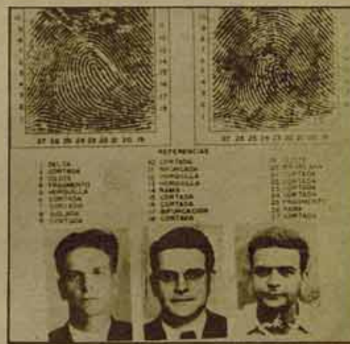
Confirmación de la identidad de Mercader.