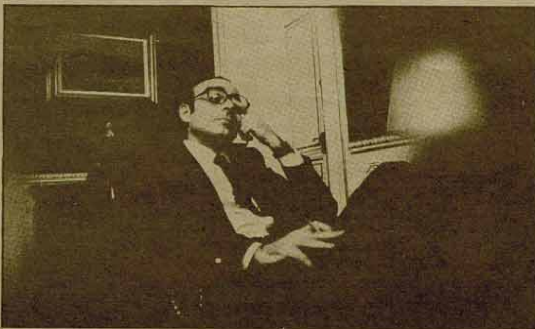
El Gobierno alimenta la ilusión de que en 1979 se producirá una recuperación económica.

que generen puestos de trabajo. Esto va contra la lógica y las necesidades del sistema capitalista y no cabe la negociación sobre ello.