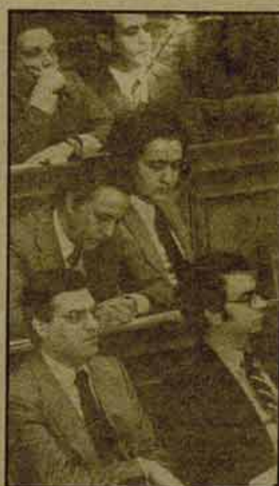
Grupo parlamentario CDS.

colaboración con los partidos burgueses, "para salir conjuntamente de la crisis", es decir, para sacarles las castañas del fuego a la burguesía portuguesa, que bastante difícil lo tiene. De esta manera, Mora Pinto podrá continuar con la política marcada por Eanes y respetada por los socialistas y comunistas.