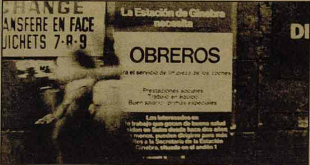
La emigración nunca fue salida.