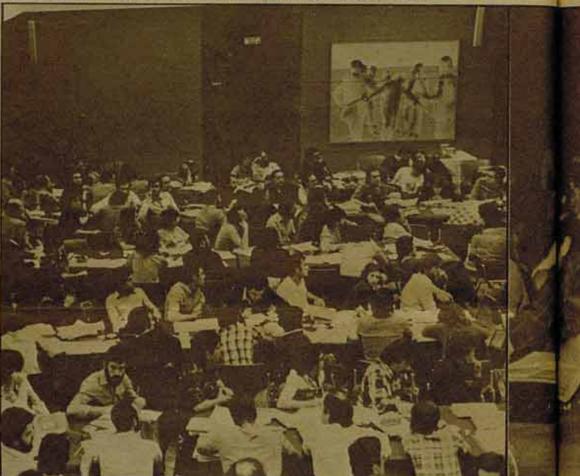
El Congreso en sesión.