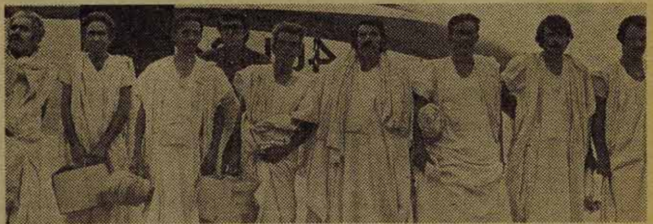
Los pescadores de "Las Palomas" en Madrid