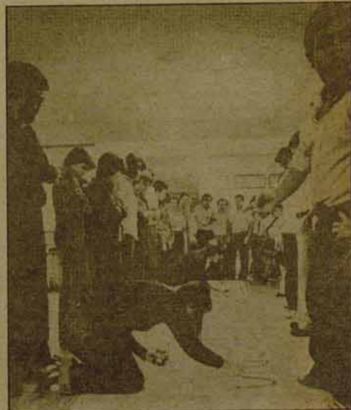
Participar en la lucha... contra los expedientes