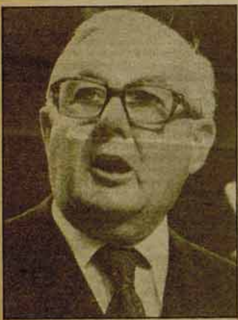
James Callaghan, Primer ministro británico, jefe del laborismo.