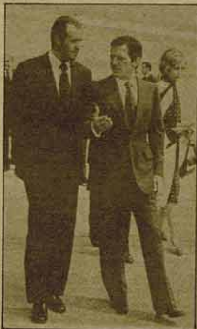
Suárez y el Rey.

Tiempo habrá para volver sobre las ideas y proyectos de Suárez, en ocasión del inminente congreso de la UCD. Pero ya ahora merece la pena llamar la atención sobre dos de los temas que aparecen en la entrevista, útiles para un objetivo fun-