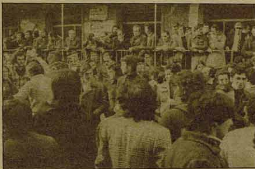
Que se discutan estas propuestas en todas las instancias del sindicato.

social, mientras las perspectivas de la firma de éste se van perfilando, pero las conversaciones no han entrado todavía en acción, mientras todo esto pasa, los trabajadores, los millones de afiliados a las centrales sindicales no andan desprevenidos y los debates empiezan a generalizarse en fábricas y en sindicatos.