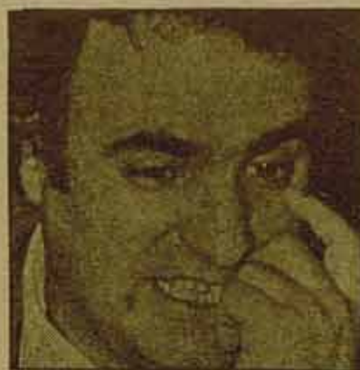
Enrique Múgica: Las leyes militares son «un acontecimiento histórico».

Sigamos. Resulta que este país va a tener una Constitución. Resulta que se supone que el ejército está obligado a respetar y obedecer esta Constitución. Resulta, también, que la misma Constitución prevé supuestos (llamémoslos así) de suspensión de los derechos constitucionales, estados de emergencia en los cuales el ejército pasa a jugar un papel de primer plano, asumiendo funciones directas de poder. Y resulta, en fin, que nuestros señores parlamentarios no tienen la menor intención de controlar quién, concretamente, va a asumir esos podes