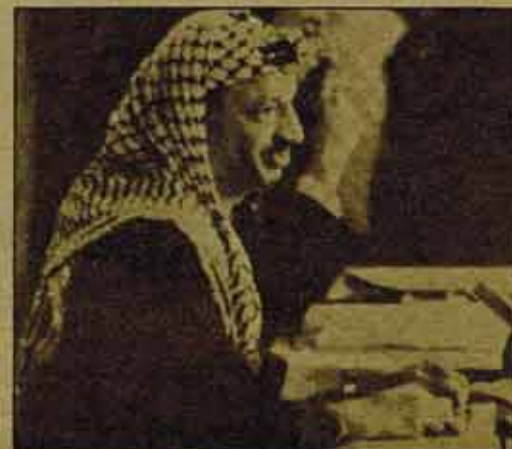
Yasser Arafat en la misma cumbre. Las tres firmas de los acuerdos de Camp David. Inauguración de la cumbre del Frente de la Firmeza en Damasco.