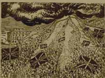
EUSKADI: Revista del PNV

partido burgués, punto. Olvidándose de añadir que casi ningún otro partido burgués en el mundo había logrado el apoyo activo de grandes sectores populares incluida una fracción de la clase obrera.