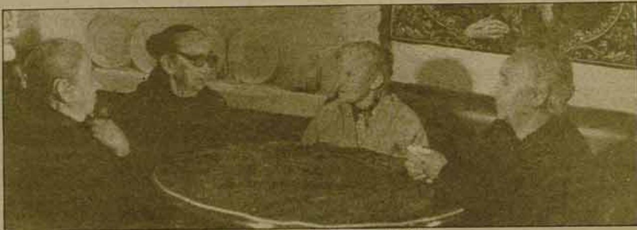
... Esa famosa mayoría silenciosa que le vota...