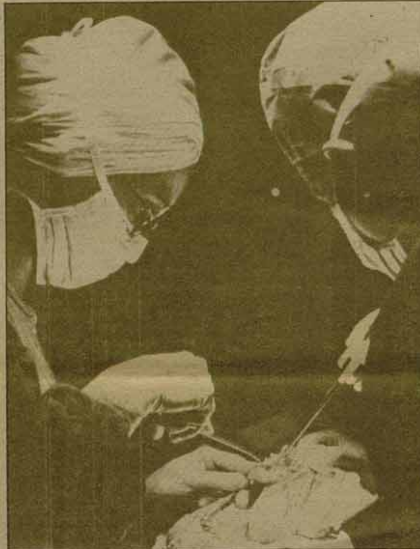
El caos de la Sanidad pública, privatización enmascarada.

Resulta sorprendente que si el Ministerio quiere reducir gastos atacando la corrupción, no ponga en