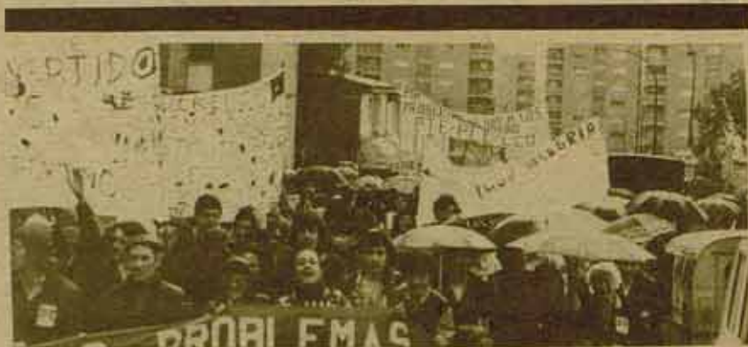
MADRID. MANIFESTACION EN MANOTERAS

La campaña nos parece un medio efectivo de iniciar una batalla que nos permita conseguir el