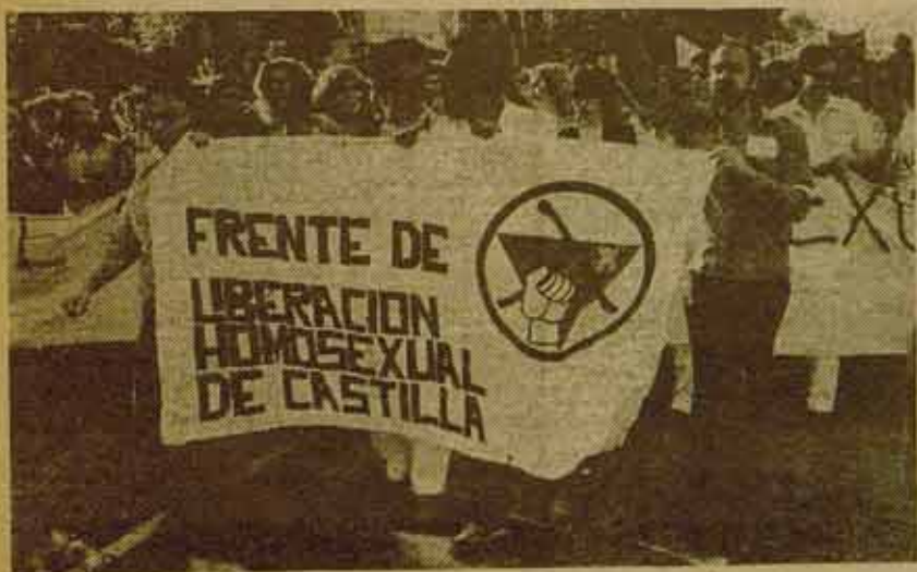
25 de Junio/Día Internacional de la Liberación Homosexual