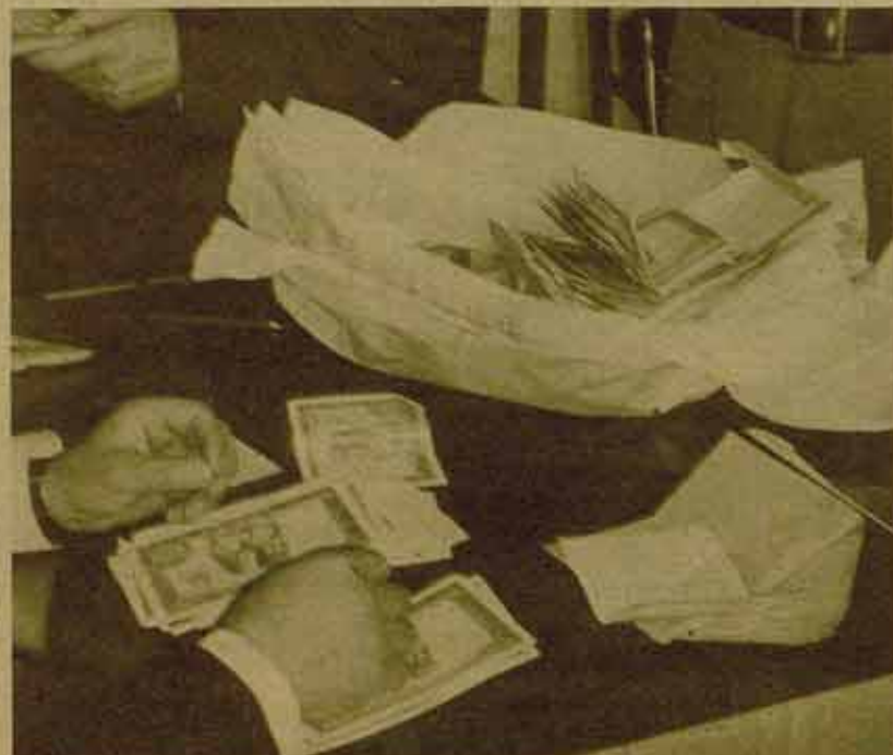
Millones que cuestan paro, inflación y quiebras.

En el caso del particular que pide dinero, el problema se acrecienta. Dado que el crédito está limitado, los bancos seleccionan muy mucho a quien se lo dan. A quien pueda pagar más por él y sea de confianza.