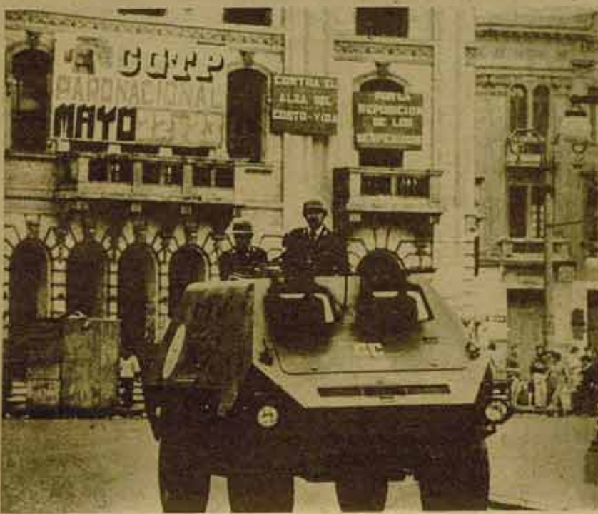
La policía y el Ejército ocuparon las calles de las principales ciudades, así como la sede de la CGTP...

Produce: plata, bismuto, plomo, cobre, petróleo... y algodón; arroz, cacao, café... y pesca.