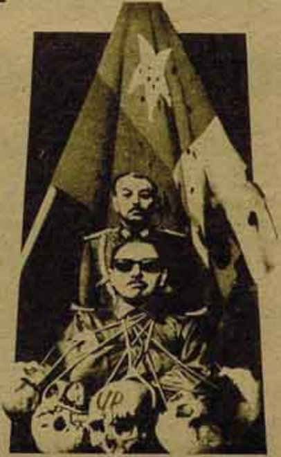
Josep Renau. "Chile" 1973

— En segundo lugar, es la recuperación histórica de un quehacer comprometido política y socialmente.