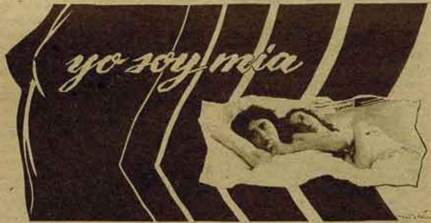
Cartel y frases publicitarias de la película. Deformación del feminismo, mercancía rentable

Como mujer emancipada, para ello no había diferencia entre hombre o mujer... ¡Sólo le importaba su satisfacción sexual!