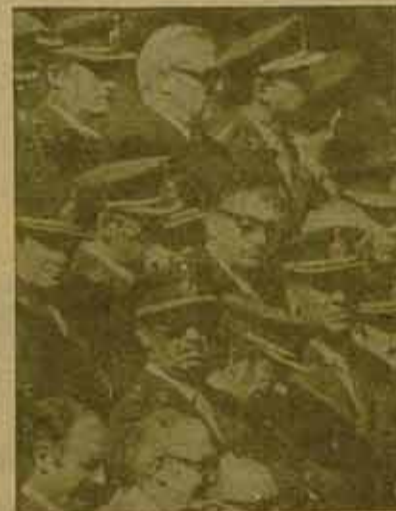
Fuerzas Armadas Argentinas, su acción requiere constantes pantallas"

La campaña pro boicot llegará pronto a su fin. Algunas iniciativas unitarias se siguen intentando hasta último momento para realizar algunas acciones de los partidos obreros, COBO y COSPA de denuncia de los mundiales, aunque no se acuerde