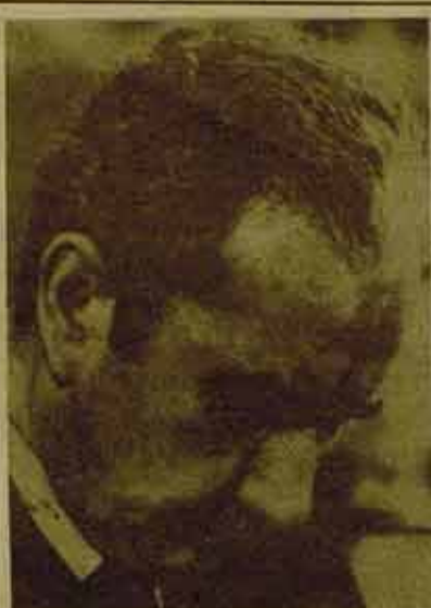
Aldo Moro: sacrificado "para salvar la República"

Y ello es así porque más allá de la suerte del presidente de la Democracia Cristiana (DC), es el conjunto de la evolución política de Italia lo que está en juego. Desde el primer día del secuestro de Moro, el PCI se ha declarado inmediatamente a favor de la firmeza más severa frente a los terroristas y se ha comprometido a aportar su apoyo a la DC para que ésta también emprenda la vía de la firmeza. Para el PCI, un Estado que cede al chantaje no merece este apelativo y de alguna manera se trata de "la vida de Moro a cambio de la supervivencia de la República", según la expresión del diputado comunista Trombadori.