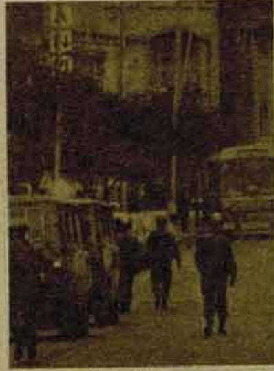
Respuesta del gobierno a las reivindicaciones obreras.

La respuesta del día 25 ha sido un fracaso porque de unos 100.000 trabajadores que hay en Vigo, sólo pararon 20.000, siendo el sector más afectado el del Metal y Construcción Naval. Por la tarde se realizó una manifestación a la que asistieron más de 10.000 trabajadores produciéndose un enfrentamiento entre la USO y las centrales y partidos convocantes, diciendo la primera que ellos, los trabajadores de Ascón, eran los que de-