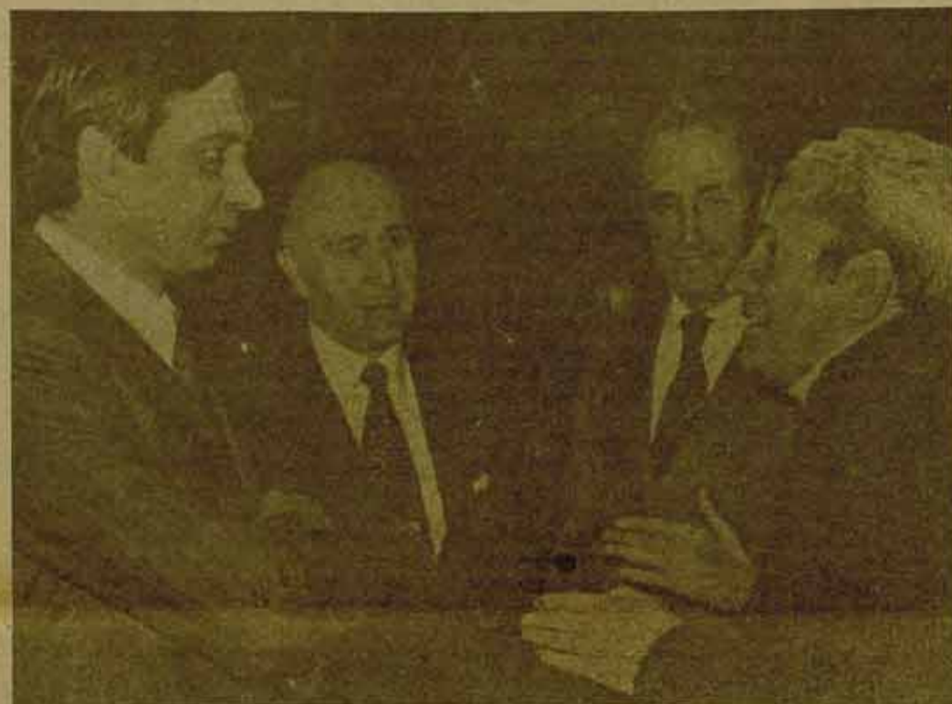
La alternativa contra la CEOE no es el "compromiso sindical" con el Ministro de Trabajo

La calma del "consenso" —en que UCD y los partidos obreros discuten a media voz para acabar pactando, los segundos a favor de la primera—, ha quedado parcialmente rota. Las modificaciones introducidas por la ponencia de las Cortes (donde UCD estaba en minoría) al proyecto de acción sindical enviado por el Gobierno, han sido la señal para que las organizaciones patronales, encabezadas por la CEOE, emprendan una violenta ofensiva anunciando la ruina del país y el crecimiento del paro, chantajeando con el fantasma de la "huelga de inversiones".