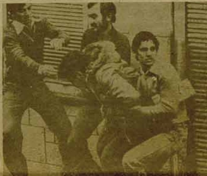
Hace un año, prohibición y represión