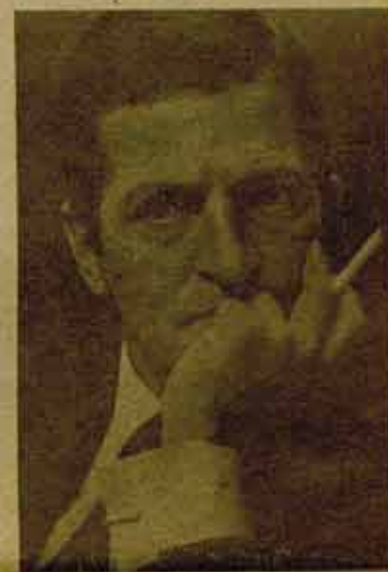
Se le puede y se le debe vencer