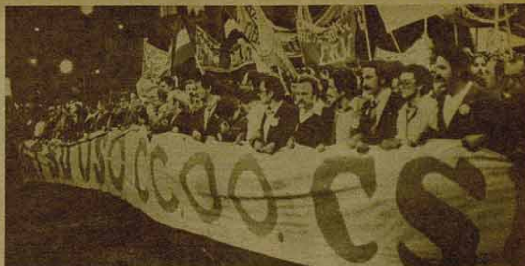
La unidad sindical: objetivo principal