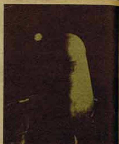
Missile soviético en el silo. La construcción de armas nucleares por la URSS ayudó a evitar la Tercera Guerra Mundial

Pero el hecho es que la Unión Soviética fue víctima de la agresión imperialista desde el primer momento. Cuando la clase obrera tomó el poder en 1917, el nuevo Gobierno revolucionario no planteó amenaza militar alguna a ningún otro país. Por el contrario, su primera medida fue publicar todos los tratados anexionistas del régimen zarista y llamar a terminar la Primera Guerra Mundial.