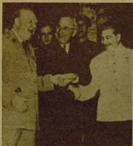
Churchill, Truman y Stalin