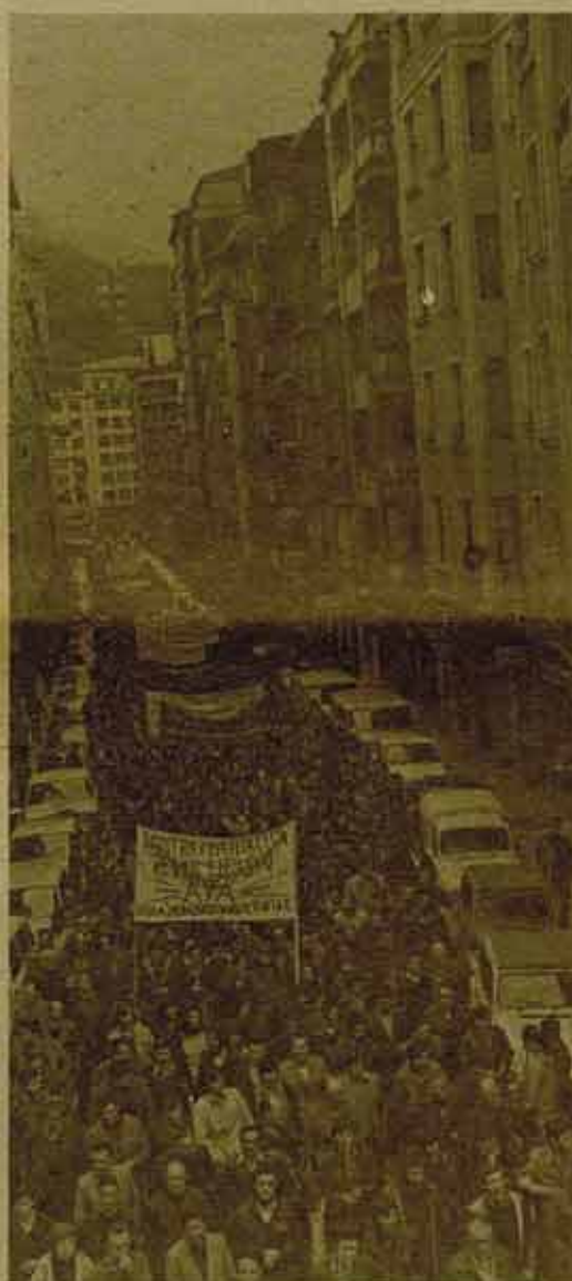
Recoger hoy todas las reivindicaciones (metalúrgicos/EIBAR - Guipúzcoa)

Y que las manifestaciones sean la más viva estampa de un movimiento obrero unido al frente de todos los oprimidos: desde los grupos de fábrica que vayan unitariamente a la manifestación, con las banderas de todos sus sindicatos entremezcladas, hasta los cortejos de las Centrales obreras que junto a la lógica afirmación de la propia Central deben llevar consignas de unidad. Y junto a ellos, que los jóvenes, las mujeres, cada sector del movimiento organice sus propios cortejos dentro dentro de la manifestación, para que sus reivindicaciones se oigan, para que su lucha se conozca.