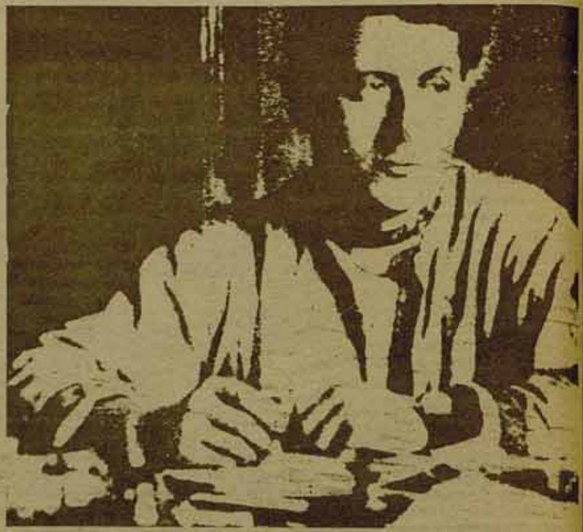
Andreu Nin en el origen del POUM

4) En cuanto a las "faltas gravísimas del POUM" en la revolución española, la discusión sigue abierta y,