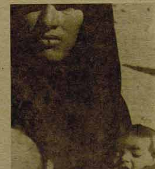
Los hombres combaten con las armas