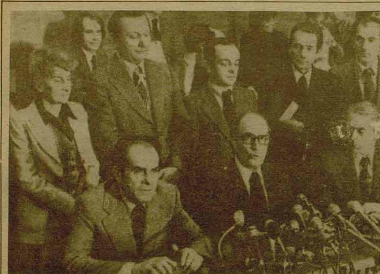
La victoria de las derechas pone en cuestión la pesada responsabilidad de los partidos de izquierda