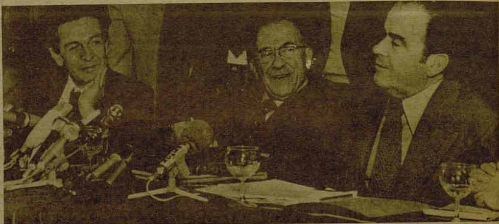
Legenda: Un compromiso histórico y un concentrado democrático se rien de un programa común; ahora le felicitarán por el fracaso en las elecciones generales francesas