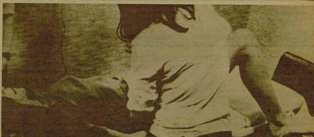
Trescientos mil abortos clandestinos se calcula que hay anualmente en España

La lucha por los anticonceptivos y el aborto libres, es una de las batallas fundamentales del MLM hoy en todo el mundo. Este derecho de las mujeres a obtener el control de su propio cuerpo necesita para su consecución de las aportaciones de todas las compañeras que en los diferentes países sostienen diariamente una batalla común contra la represión, la falta de información, el peso de la ideología dominante y la falta de comprensión de gran parte de la población sobre estos temas. En este sentido, nos parece importante publicar el manifiesto que grupos de mujeres del MLM de Francia han elaborado sobre el aborto y con el cual aquí nos solidarizamos.