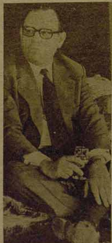
Barre brinda. Adelante con la austeridad

Esta derrota pesará incontestablemente sobre los elementos más conscientes de la clase obrera, sobre aquellos que buscaban una salida política de las luchas. Es necesario, a pesar de