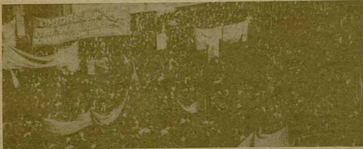
Cien mil trabajadores asturianos: nacionalización de la siderurgia