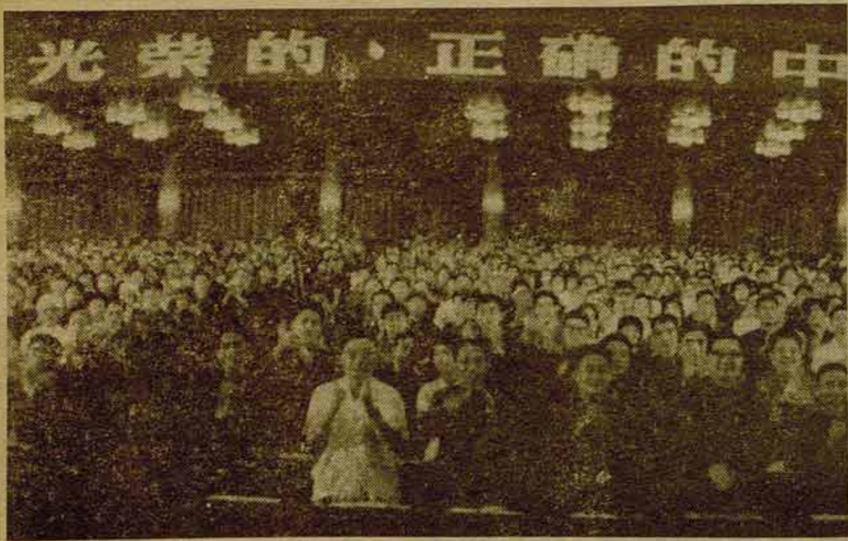
V Asamblea Nacional Popular China