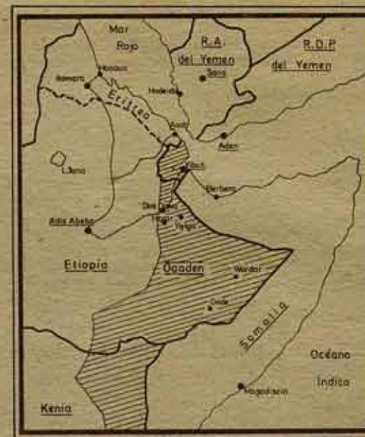
El cuerno de AFRICA