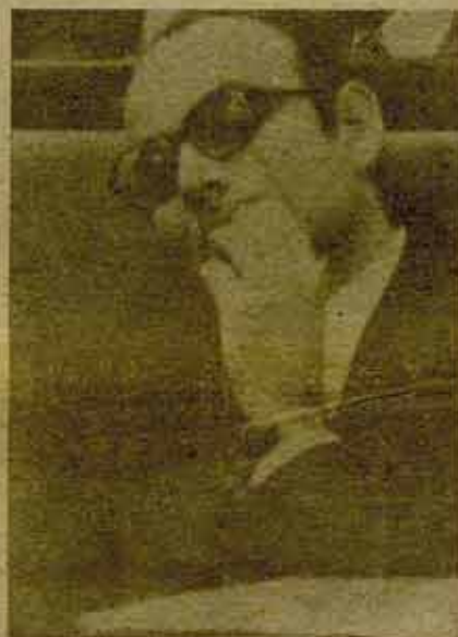
Abril Martorell: Superministro económico