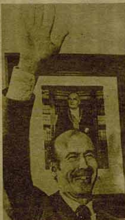
Giscard se despide...

En el próximo número: La crisis de la Unión de la Izquierda y la alternativa de los revolucionarios.