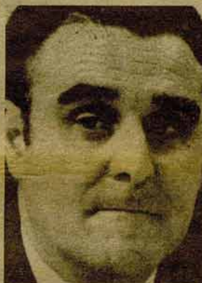
Rodríguez Sahagún: Reactivar la economía