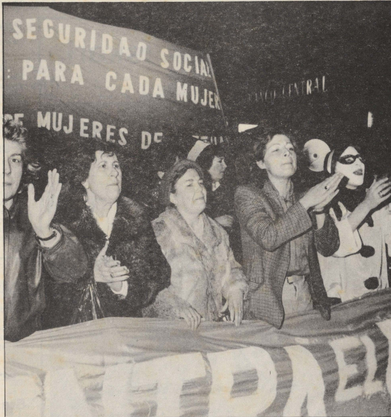
Bizkaiko Emakumeen Batzarrak emakumeen ekintza bat, Bilbon, abenduaren zortzirako OTANen kontra, konbokatzen du. Asanblada bezala gai honi buruz egin diren mobida guztietan

parte hartu izan dugu: gizakatean, Reaganen kontrako manifestapenean, hizkietan. Eta gainera, ekintza hauek prestatzeko hainbat hitzaldi egin dugu.