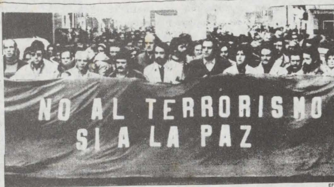
Un momento de la manifestación celebrada ayer en Irún.

UN RESPONSAL. San Sebastián. Unas cinco mil personas se manifestaron ayer en Bilbao en demanda de amnistía para los presos vascos, secundando el llamamiento efectuado por Herri Batasuna y la izquierda parlamentaria vasca. La manifestación, que constituía el cierre de la campaña pro amnistía que viene celebrándose a lo largo de Euskadi en las últimas semanas, estaba encabezada por una gran pancarta con la inscripción: "Amnistía porosa" (amnistía total) que llevaban las madres de los presos vascos. Los manifestantes corearon consignas a favor de los presos y de ETA Militar y contra la policía, antes de disolverse en la plaza del Arenal. Durante la marcha, iniciada a las 12.30 horas en la plaza del Sagrado Corazón, no se registraron incidentes. La policía no intervino. Diversos ayuntamientos vasco-saprobaban días atrás mociones presentadas por las gestoras pro amnistía en las que se destaca la necesidad de una amnistía como paso previo para la normalización democrática en Euskadi.