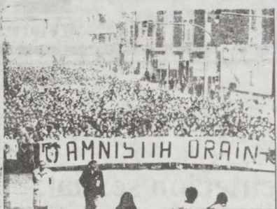
La manifestación fue convocada por las gestoras pro-amnistía y partidos de la izquierda abertzale