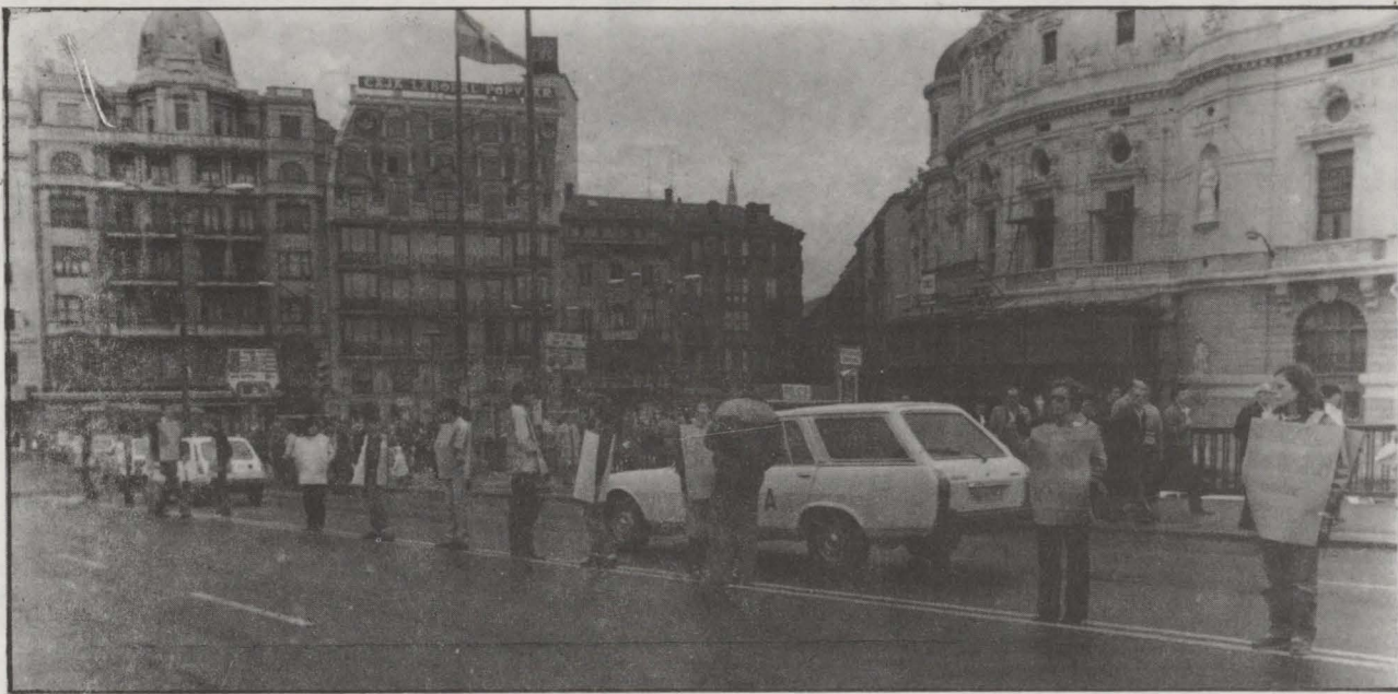
Arenal de Bilbao. Domingo 7 de noviembre, familiares y amigos de presos al salir del encierro continúan la lucha.

En Basauri hay en estos momentos unos 300 presos sociales y 9 presas. Tras la huelga de hambre mantenida, en la que han explicado sus reivindicaciones, han adoptado nuevas formas de lucha. Esto lo explican los presos en un comunicado al dejar la huelga de hambre. Otros presos del Estado también han estado en huelga de hambre, algunos todavía siguen, pero ha sido en Vizcaya el único sitio donde en el exterior se han manifestado luchas en su apoyo. La organización y las formas que ha tenido esta lucha solidaria la ha recogido Zutik en el encierro de amigos y familiares que tuvo lugar durante la huelga de hambre de los presos y presas la semana pasada en Bilbao.