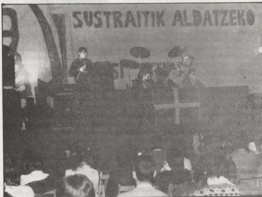
Un momento del mitin de Pamplona

La lucha contra el desempleo ha ocupado un lugar primordial en todos los actos de nuestro partido. En todas las intervenciones se ha