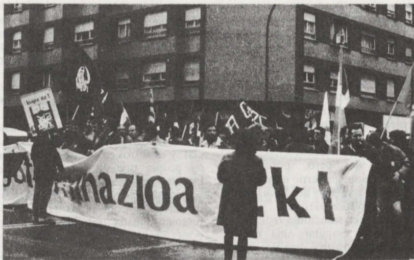
Tras los cartelones la tercera fila del cortejo de LKI