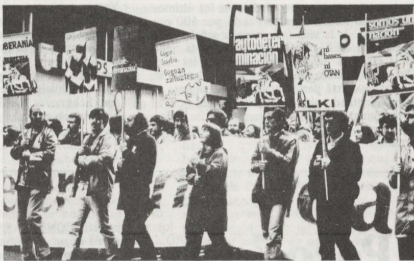
Segunda línea del cortejo de LKI con los "cartelones" a que se alude en la nota a DEIA