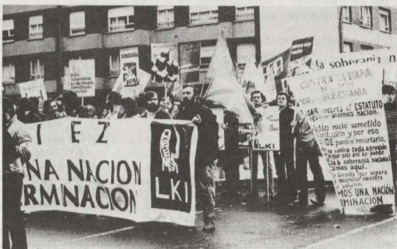
Aspecto parcial de la pancarta de cabeza del cortejo de LKI

Pero, en fin, más valen imágenes que palabras para ilustrar que el DEIA mentía: