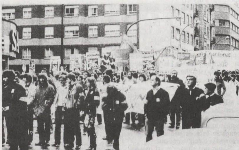
Aspecto del cortejo de nuestro partido visto desde delante. En primer plano algunos Hertzainas. Como se ve, tanto en esta foto como en las otras (con excepción de la 2) la manifestación no se había puesto aun en marcha; al hacerlo se sumó a ella bastante más gente aún de la que se ve en la foto; en todo caso ¿cómo puede hablarse de tan sólo "medio centenar de manifestantes"?