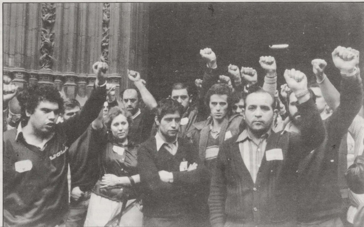
Viernes día 9 de Enero. En Asamblea celebrada en el Pabellón de Deportes de Bilbao los trabajadores de Olarra, tras tres meses de lucha dirigida por el Cte. de Empresa, deciden por votación de 1.800 contra 100 facultar a las Centrales Sindicales (ELA, UGT, CCOO, y USO) para llevar en exclusiva, es decir sin participación del Cte., la negociación de un posible acuerdo con el empresario

Por otro lado el observar cómo el movimiento de solidaridad, que si bien es cierto que tomó fuerza en barrios y pueblos, e Institutos, nunca pasó de discreto en las fábricas, tal y como lo demuestra la Jornada de Lucha del día 14 de Noviembre y la desgraciada experiencia de la convocatoria de Huelga General del día 11 de Diciembre, no apoyada por nuestro partido y que mas que solidaridad, por sus métodos no consiguió sino exasperar en su contra a amplios sectores del pueblo.