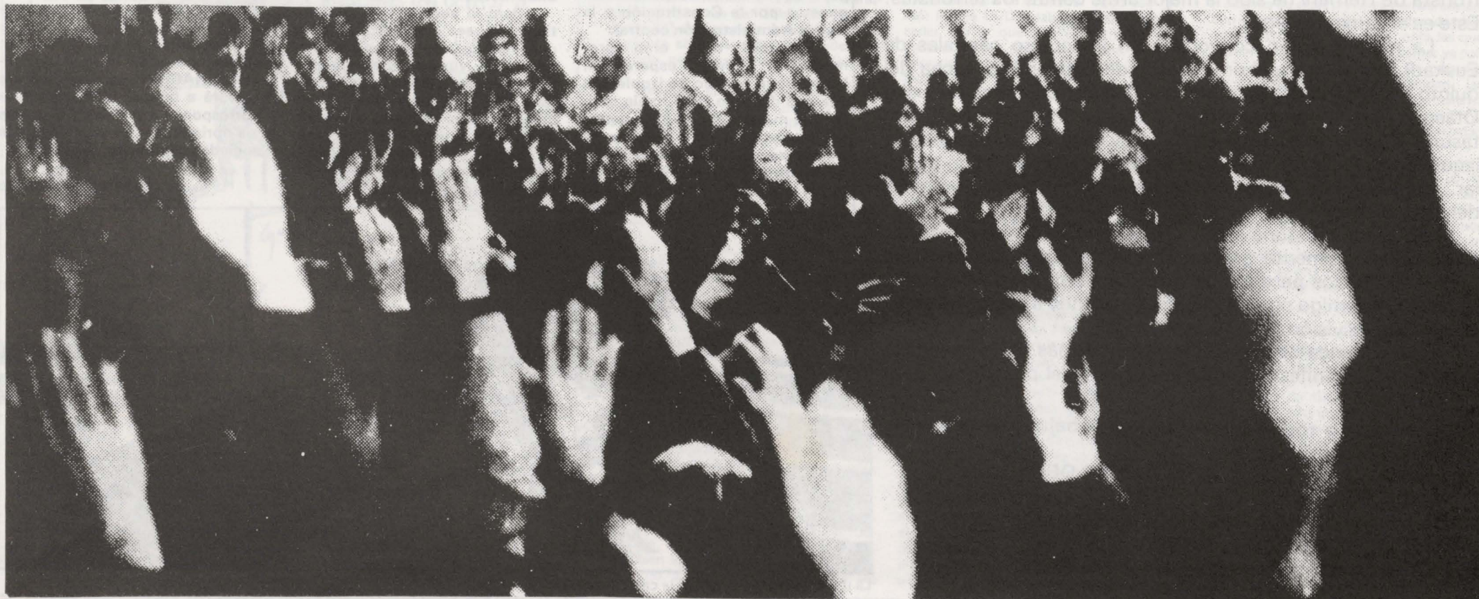
EL TEXTO DE ENMIENDAS PRESENTADO POR LKI AL CONGRESO, SALDRA EN EL PROXIMO NUMERO DE ZUTIKI!

En la dirección resultante figura un militante de E.E. y varios miembros tímidamente "críticos" de la línea ultraconservadora del PCE.