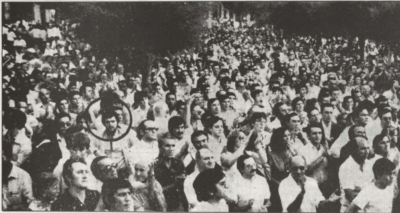
El individuo de la fotografía manifestante con la "violencia", apunto poco después con una pistola a algunos contramani- festantes

1 Nafarroa dejó de ser hace ya tiempo la cuna de la reacción. El fortalecimiento del movimiento obrero, las luchas de los campesinos humildes, la extensión de la conciencia nacional vasca, el descalabro del carlismo y la crisis de la Iglesia tradicional, el avance de las fuerzas de izquierda en los principales ayuntamientos... acorralaron a la derecha navarra, aunque ésta siguió conservando su poder y sus privilegios.