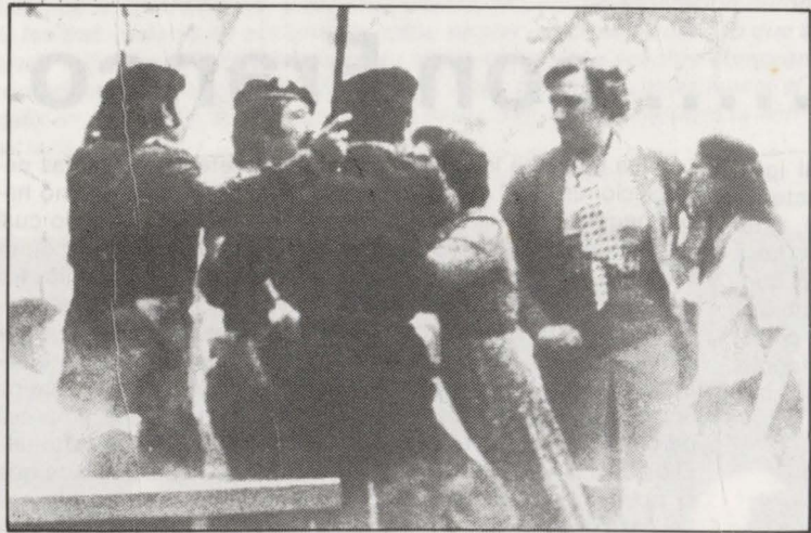
SABADO 10: Las FOP golpean en el Arenal bilbaino

Eta faxisten kontrako burruka egun hau prestatzeko, urrengo 29an Madrilen eta Kataluinean helburu berberaren aldo konbaturik dagoen burruka eguna hartuko dugu adibide eta ikuspegi bezala.