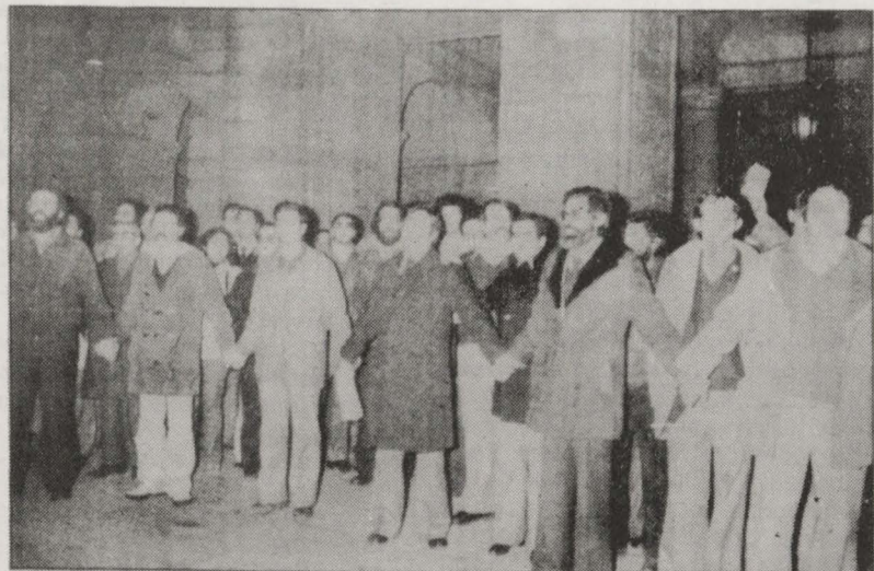
Parlamentarios, alcaldes, concejales y representantes de partidos políticos gallegos durante la manifestación de protesta por el Estatuto celebrada el jueves en Santiago.