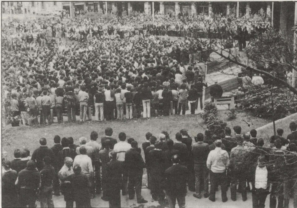
Concentración del día 5 en Sestao