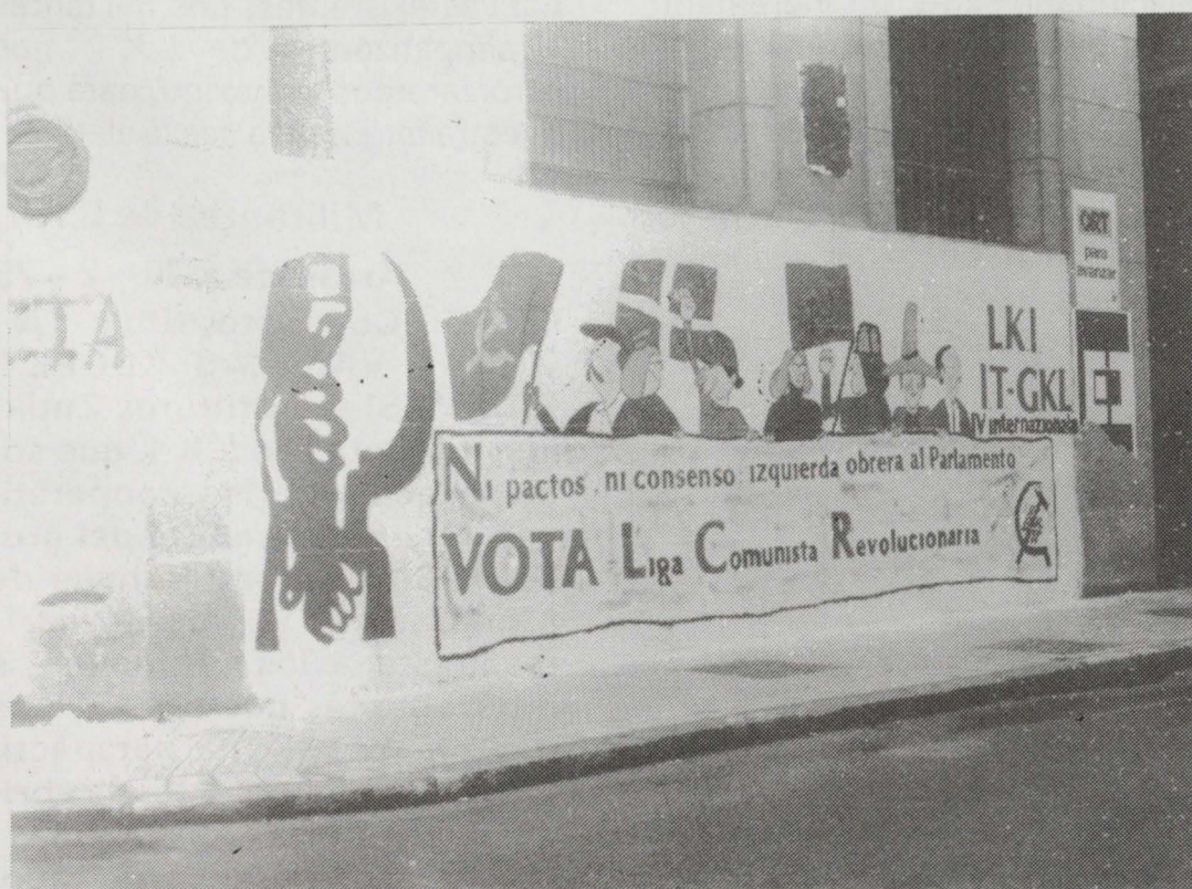
Mural realizado en Durango durante la campaña

6- Las elecciones municipales van a clarificar las cosas. Seguramente la relación de fuerzas expresada en las generales va a marcar la pauta de lo que van a ser las municipales. Para todos los partidos obreros vencer a la derecha va a estar indisolublemente ligado a derrotar al PNV, representante de la burguesía vasquista. Y para conseguirlo hace falta la unidad de la izquierda en los municipios, la formación de un bloque de izquierdas que dirija el municipio si es mayoría, o que forme una sólida oposición si está en minoría. Herri Batasuna debe decidirse a formar parte de este bloque de izquierdas, lo que significa rechazar cuantas proposiciones le sean hechas —desde fuera o desde dentro de Herri Batasuna— de aliarse con el PNV para derrotar a "los estatistas". En esta simple cuestión Herri Batasuna decidirá su lugar en Euskadi, o con la burguesía o con los trabajadores.