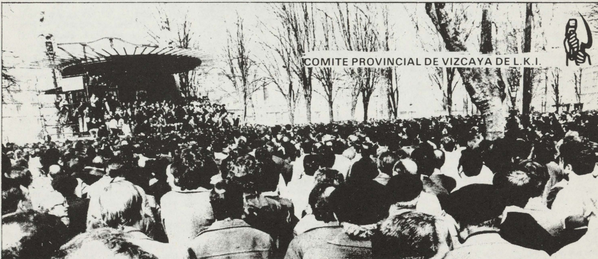
COMITE PROVINCIAL DE VIZCAYA DE L.K.I.

Sólo así los trabajadores verán a los sindicatos como a sus organizaciones. Las que le sirven para luchar y defender sus intereses. Este es el objetivo en el que están empeñados todos los militantes de LIGA KOMUNISTA IRAULTZAILEA.