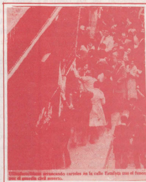
Manifestación acercando carteles en la calle Estafeta tras el funeral por el guardia civil muerto.