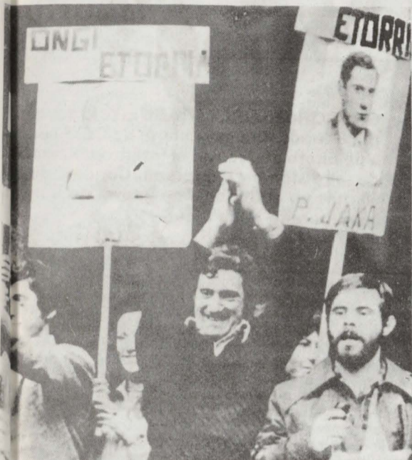
Josu Ibarretxe y Patxi Jaka saludando a la multitud (unas 10.000 personas) desde los soportales del Ayuntamiento de Eibar. Ambos habían sido detenidos en vísperas del 1º de Mayo de 1968 gravemente heridos por la explosión de una bomba que intentaban retirar de los locales del "Correo Español" en Eibar porque había quedado un empleado en las oficinas.