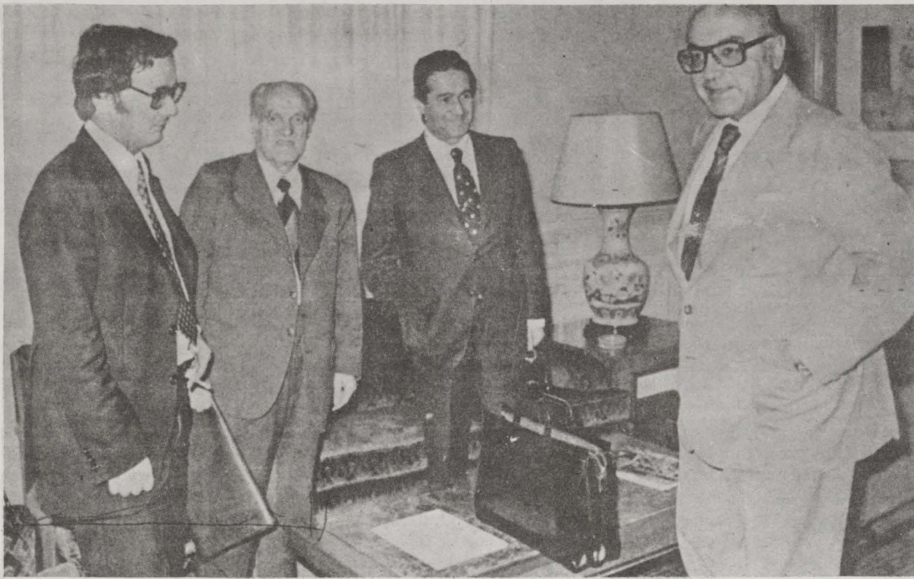
AUN MAS RECORDADO

El preautonómico ya está aquí. Tras dos meses de conversaciones, un par de trámites administrativos nos separan del régimen preautonómico provisional. Entre pasillos se ha podido oír el rumor de que el acuerdo estaba alcanzado en lo esencial hace varias semanas, pero que razones de "oportunidad política" habían llevado a los dirigentes del PNV y del PSOE a retrasar su aparición. El toque de atención que quince organizaciones de la izquierda dieron en Escoriaza ante el contencioso de Navarra fué sin duda uno de los motivos que les indujeron a esa congelación momentánea. Se trataba, para ellos, de crear un clima favorable en esas semanas, especialmente a través de forjar una actitud de dureza ante el problema navarro.