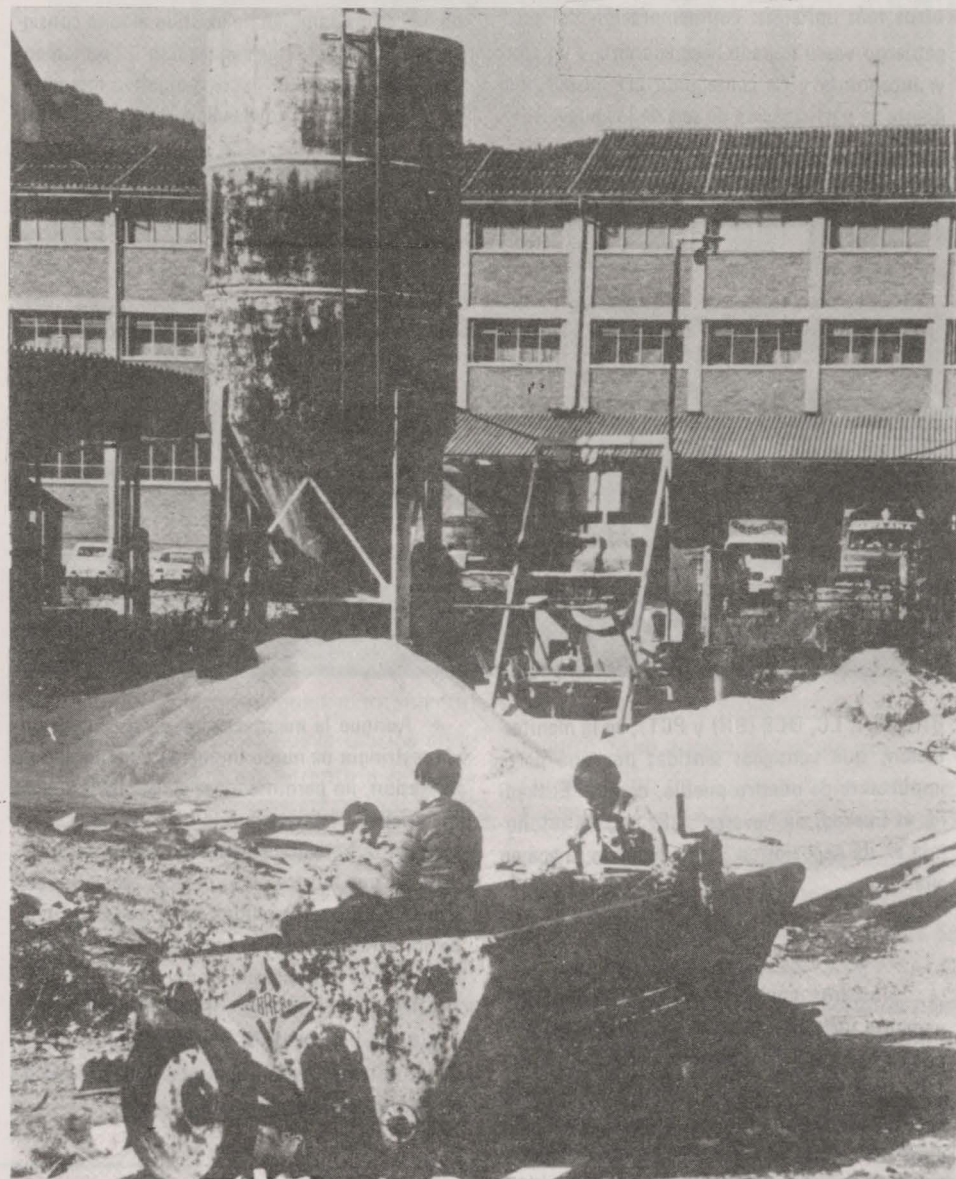
faltan zonas verdes, consecuencia de una mala gestión municipal

rogación de la Ley de Régimen Local y elaboración de una Ley municipal democrática, exigencia de una Ley electoral, igualmente democrática, etc.