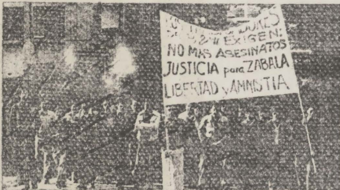
Los trabajadores de Babcock Wilcox subiendo en manifiesta- cion por la cuesta de Galinde.

Greba oñokor hau garaipen handi bat izanda, bai- na asanbladetan garbi agertu da hau ez dela epe luzerako - erasaldi baten hasiera baizik, batez ere irailaren 27-rako - espero den mobilizazio orokorraren egunaren entsegu jenera- la. Euskadin gai berri jenderik bil badezake, dudarik gabe, presoen etxeratzearena da. "Presoak kalera" hainbeste oihu- katu den uda honen puntu gailurrena bezala, 27-ko mobiliza- zioa, bizi ditugun egunen ondoren, ez da abiapuntu bat bes- terik, diktaturaren jeneralizatuen abiapuntua zeren egun - Euskadirentzat amnistia bakarra amnistia arkorra da, heroz keriarik gabekoa, politik eta sindikal motiboengatik langi- le jautikien onharpena ekarriko duena, langile eta naziona- lista iraultzaile alderdi guztien legeztatena ekarriko du- ena, zeren ezin dezake onhar hainbeste urteta gartzelari egon dakoa, amnistiatu eta gero, beraiz ere motibo berdinegatik espetxeratzea. Hau da: ez dago egiazko amnistiari diktadu- rahonen menpean amnistiak diktadura botatzea esijitzen du.