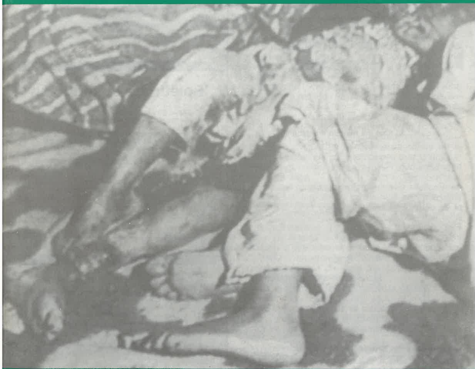
Operación Tormenta del Desierto: masacre del pueblo iraquí