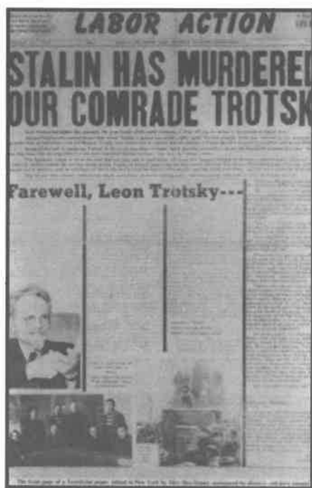
(2). Trotski, "Oeuvres", tomo 8, p.184 (EDI).

Sólo en 1938, ante la inminencia de la Segunda Guerra Mundial y tras haber agotado esas gestiones, se funda la IV Internacional en condiciones radicalmente distintas a las de las precedentes. Cada una de las tres primeras había coincidido con una fase de auge y de organización, con una victoria del movimiento obrero. Cada una de ellas contaba, de salida, con la existencia de al menos una sección de masas (inglesa la Primera, alemana la Segunda, soviética la Tercera). Por el contrario, la Cuarta nació de la derrota y tenía lo esencial de sus fuerzas en el exilio, en los campos de concentración stalinistas o nazis. De ello, algunos historiadores o militantes han llegado a la conclusión de que la fundación de la IV Internacional iba ligada por Trotski al pronóstico de que la Segunda Guerra Mundial, que preveía, llevaría a la caída del stalinismo y a un relanzamiento de la revolución mundial tan impetuoso como el que tuvo lugar inmediatamente después de la Primera Guerra Mundial. En este caso, se vería resurgir en la URSS a la corriente bolchevique revolucionaria, sin que su continuidad se hubiera roto realmente por uno o dos decenios de reacción stalinista. Este pronóstico no se cumplió. Pero la creación de la Internacional provenía de principios, no de un pronóstico. Su existencia, el manteni-