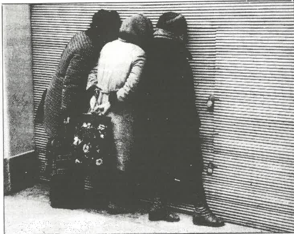
Esperando que abran una galería comercial en Moscú.

La situación actual nos da una imagen diferente. Tomemos dos ejemplos que ilustran este cambio. En 1939, en Ucrania, la mayor de las repúblicas no rusas, los rusos suponían el 54% de la clase obrera; en Azerbaidjan, la principal república del Cáucaso, el 48%. En 1959, estos porcentajes eran, respectivamente, el 26% y el 28%. El proletariado de las repúblicas no rusas ya no es un punto de apoyo para las políticas centralistas, y en estas repúblicas las reservas de apoyo a la élite rusa han disminuido.