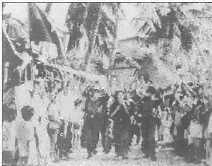
Entrada triunfal de los combatientes vietnamitas en Saigón el 30 de abril de 1975